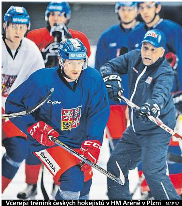
Včerejší trénink českých hokejistů v HM Aréně v Plzni.

Zápas v HM Aréně s kapacitou zhruba 7500 míst začne v 18 hodin. ČTK