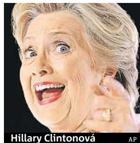
Hillary Clintonová

Před úterními prezidentskými volbami v USA favorizují místní, britské, ale i irské sázkové kanceláře demokratku Hillary Clintonovou. Šance jejího republikánského rivala Donalda Trumpa se ale s blížícím datem hlasování zvyšují. Portál electionbettingodds.com, který nabízí pravděpodobnost vítězství některého z kandidátů i pro jednotlivé státy, očekává, že preziden-