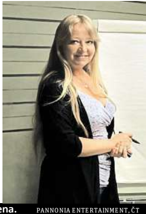
PANNONIA ENTERTAINMENT, ČT

ka získala odměnu 10 tisíc korun a povýšení, které jí následně bylo odebráno. Nesvačilové se podařilo navázat filmový vztah i se samotným Berdychem a bývalými členy jeho gangu a někdy se podle svých slov docela bála.