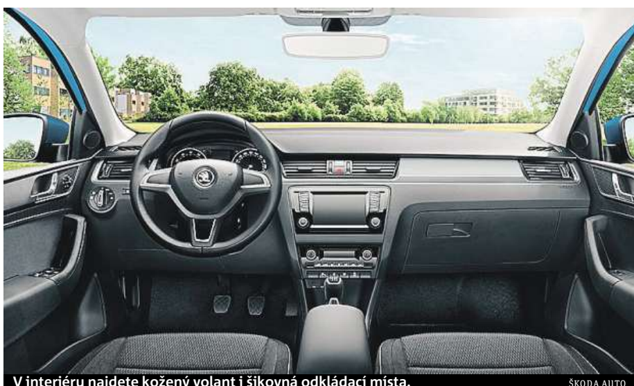
V interiéru najdete kožený volant i šikvná odkládací místa.