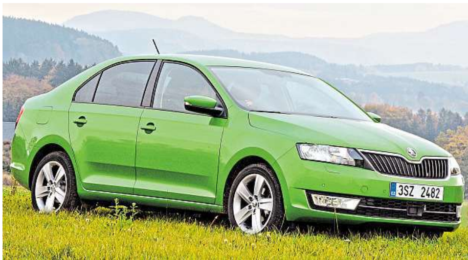
Auto mělo metalízu pojmenovanou Rallye Green.