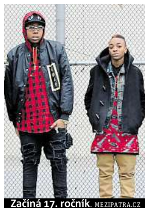
Začíná 17. ročník. MEZIPATRA.CZ

Například snímek Erica Juholy Holkou od malička sleduje příběh rodičů, kteří žalují školu, již navštěvuje jejich šestiletá dcera Coy. Protože je trans, rozhodlo vedení školy, že smí používat jen toalety vyhrazené pro učitelský sbor. První soudní spor svého druhu v USA se stane mediál-