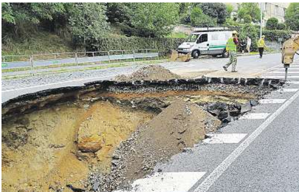
Kráter ve vozovce už je sice zasypaný, ale pod silnici v osmimetrové hloubce se stále pilně pracuje.

Deník Metro měl včera možnost nahlédnout pod vozovku. Ve třech osm metrů