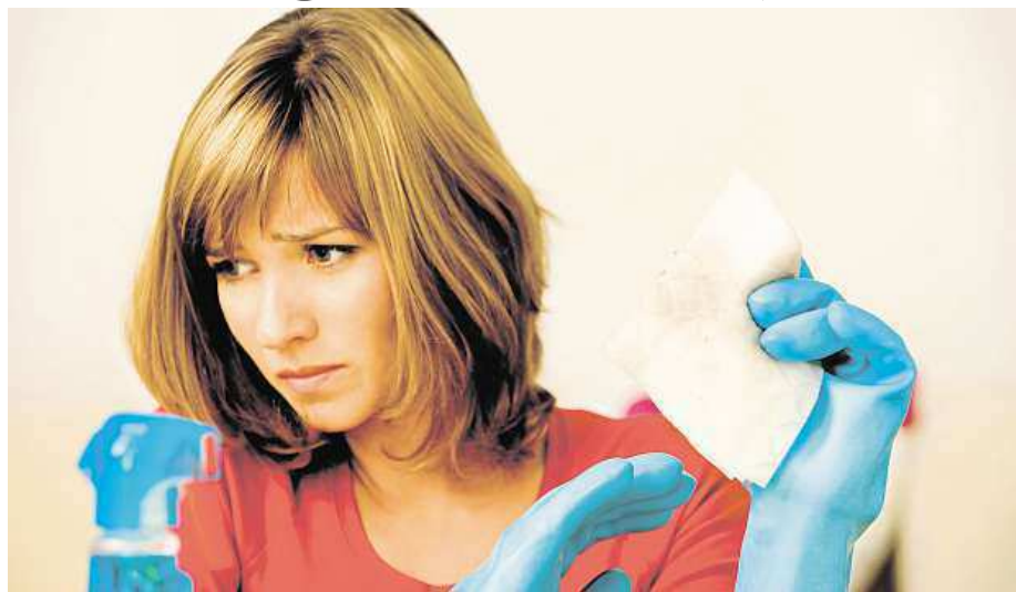
Zbavovat se alergenů je potřeba průběžně a svědomitě.

Vysávání prachu a omývání povrchů vhodným čisticím a dezinfekčním prostředkem zajistíme větší komfort. K vhodným přípravkům patří například řada Savo bez chloru, která pomáhá odstraňovat alergenů pylu, prachu a těch, které pocházejí od domácích zvířat.