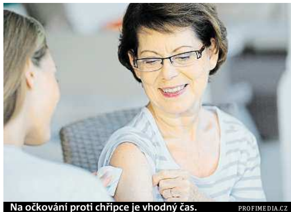
Na očkování proti chřipce je vhodný čas.

Nakazit chřipkou se může každý. Malé dítě ve školce, dospělý v produktivním věku v práci, v MHD či v nákupním centru. Lidé z rizikových skupin – hlavně ti s chronickými nemocemi a starší lidé – jsou chřipkou samozřejmě ohroženi nejvíce.