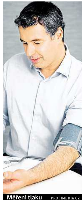
Měření tlaku

Vyskytuje se u čím dál více lidí. Přitom ale může vést až k náhlé mozkové příhodě nebo infarktu myokardu.