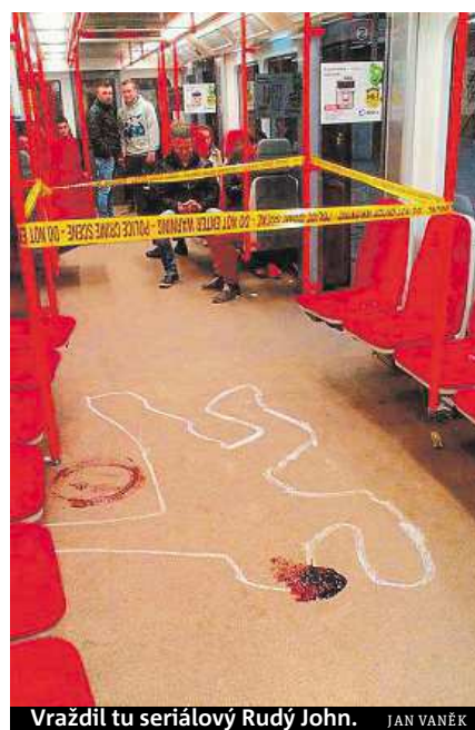
Vraždil tu seriálový Rudý John.