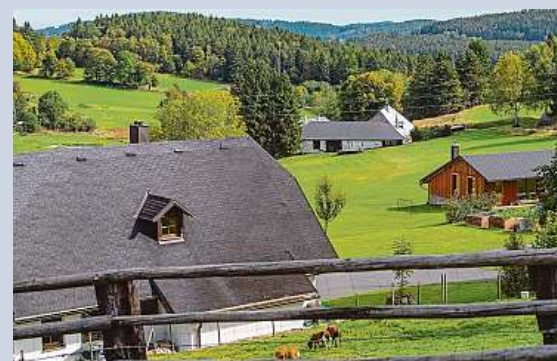
Teplé a slunečné počasí na Šumavě u Kúsova