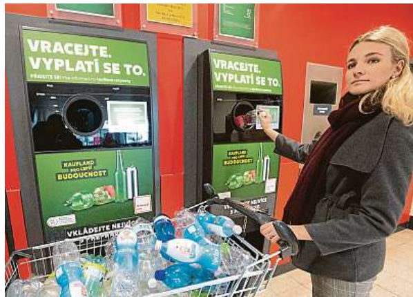
V Česku fungují PET lahve a plechovky jako vratné obaly půl roku. Zatím ale jen zkušebně ve vybraných prodejnách.

Důvod není složitý. Ze systému barevných kontejnerů jdou do pokladen obcí a regionů miliony korun. Ty pocházejí nejen z prodeje plastového a hliníkového odpadu zpracovatelům druhotných surovin. Na systém sběru při-