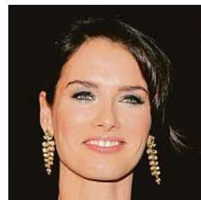
Herečka chová psy, obzvláště miluje bigly. 2x PROFIMEDIA

Zajímavostí je, že miluje horory, jejím nejoblíbenějším kouskem je řádně krvavý Texaský masakr motorovou pilou. HAL