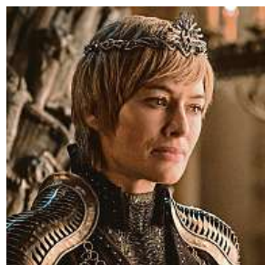
Role Cersei Lannisterové padla Leně Headeyové jako ulitá.

Krutá Cersei ze seriálu Hra o trůny trpěla poporodními depresemi.