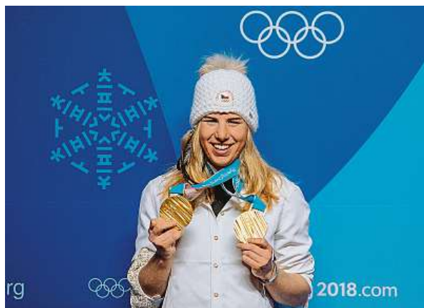
Členkou armádního sportovního centra Dukla je také trojnásobná olympijská vítězka, snowboardistka a lyžařka Ester Ledecká.

Reprezentanti Dukly pravidelně sbírají medaile na vrcholných akcích. Za celou dobu existence armádní sportovci vybojovali 104 olympijských medailí včetně 33 zlatých. Po vzniku samostatné České republiky zazářili například snowboardistka a lyžařka Ester Ledecká nebo