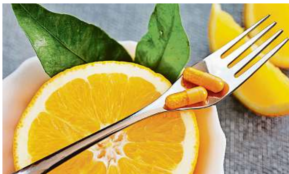
Vitamin C obsahuje vysoký podíl přírodních látek, které přispívají například k tvorbě kolagenu.

Ačkoli se nemocem plně vyhnout nedá, vždy pomůže zaměřit se na prevenci. Základem je vyvážená a nutričně