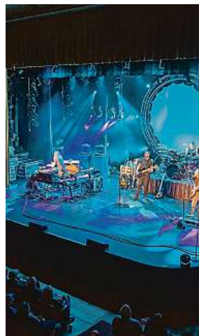
Hity od Pink Floyd si vychutnáte v Praze i Ostravě.

Spojení drsného rocku a jemné vážné hudby plné nejrůznějších hudebních nástrojů se stává v posledních letech velmi populární. Pomoc umělců ze symfonických orchestrů při svých koncertech využila například kapela Lucie, Mig 21 nebo dokonce i zpěvák Michal David a pokaždé s obrovským úspěchem u českých posluchačů.