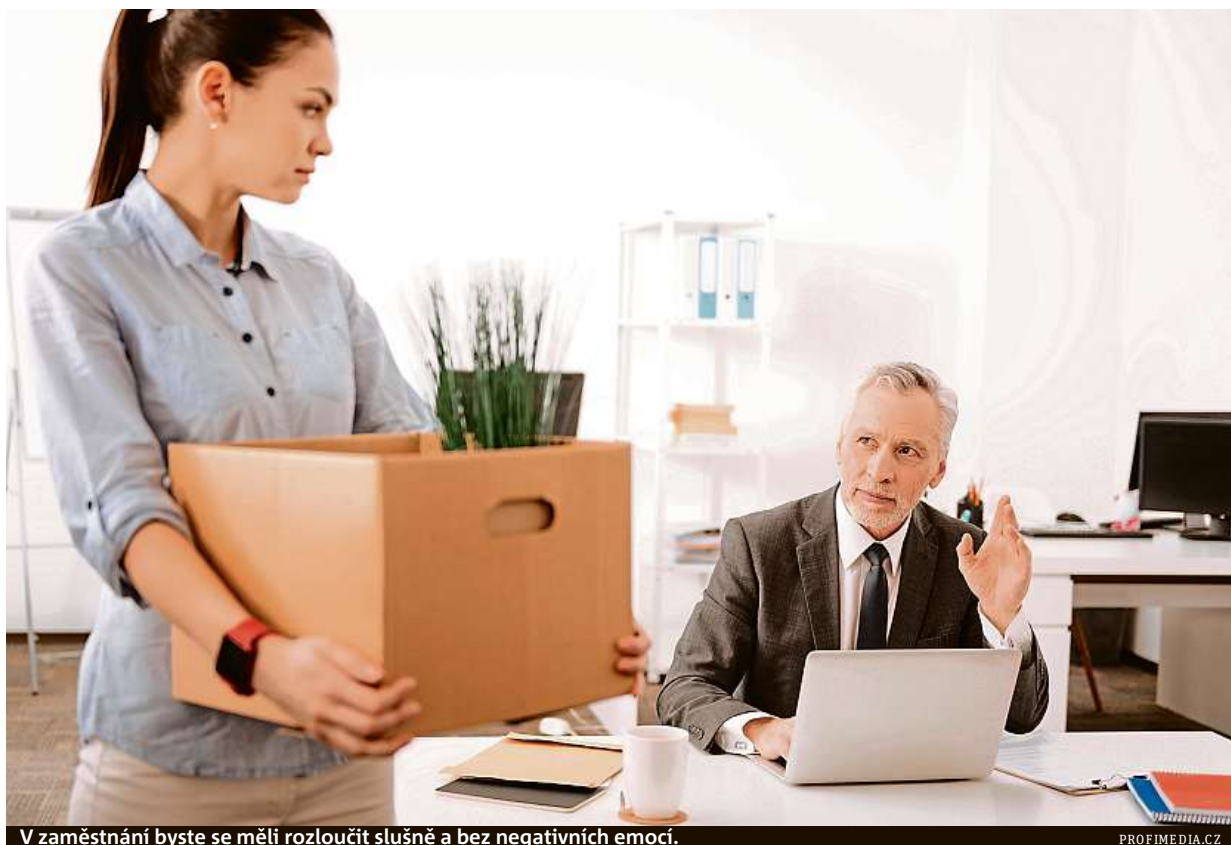
V zaměstnání byste se měli rozloučit slušně a bez negativních emocí.

Svému nástupci se vyplatí vše připravit, abyste usnadnili začátek v nové práci. To samé přece očekáváte ve