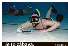
Je to zábava.