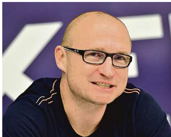
Boxer Lukáš Konečný oznamuje svůj návrat do ringu.

Konečný naposledy boxoval v dubnu 2014, kdy ve Washingtonu prohrál na body soubor o titul mistra světa ve střední váze organizace WBO s domácím Peterem Quillinem. Následně i kvůli zdravotním problémům ukončil kariéru. Od duelu s Rusem Zaurbekem Bajsangurovem v říjnu 2012 měl totiž potíže se zrakem. „Pořád mám dvojitě vidění. Čočky to srovnat neumí, proto nosím brýle. Zřejmě tak mám prasklou nějakou kostičku za okem, přes kterou se ohýbal oční sval. Někdy je to horší, někdy lepší. Omezuje mě to při rychlých sportech, jako je pinčes nebo fotbal, kdy se mi míčky