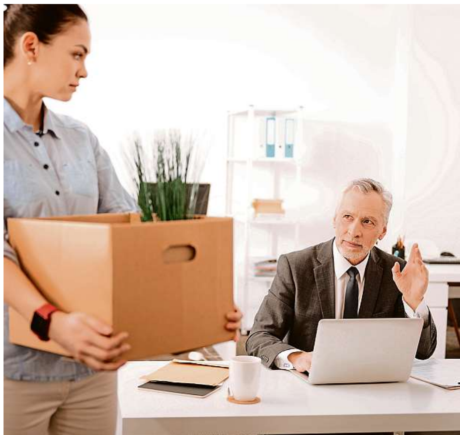
V zaměstnání byste se měli rozloučit slušně a bez negativních emocí.

jí delší dobu. „Dobře nezapůsobí ani pomlouváním předchozího zaměstnavatele. Pro nové nadřízené to může znamenat, že stejným způsobem budete v budoucnu mluvit o nich,“ uvádí Surka. MET