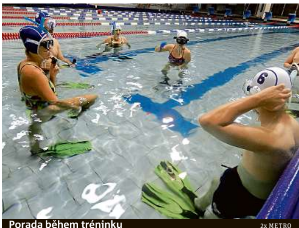
Porada během tréninku

Nádech a jdeme na to. Puk šmrdlám po dně zhruba de-