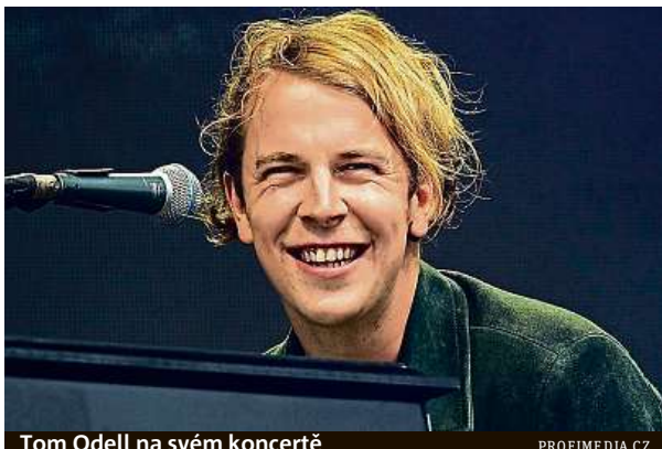
Tom Odell na svém koncertě

V Praze v lednu vystoupí talentovaný britský písničkář Tom Odell. Desku vydá 12. října.