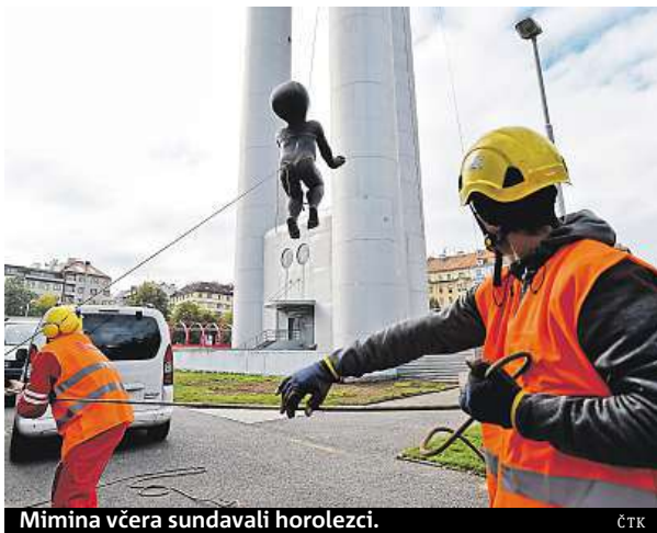
Mimina včera sundávali horolezci.

Zástupci vlastníka uvedli, že plastiky pravidelně dvakrát ročně monitorují. Sundávají se ale po delší době poprvé. Podle Černého není zřejmé, v jakém jsou stavu,