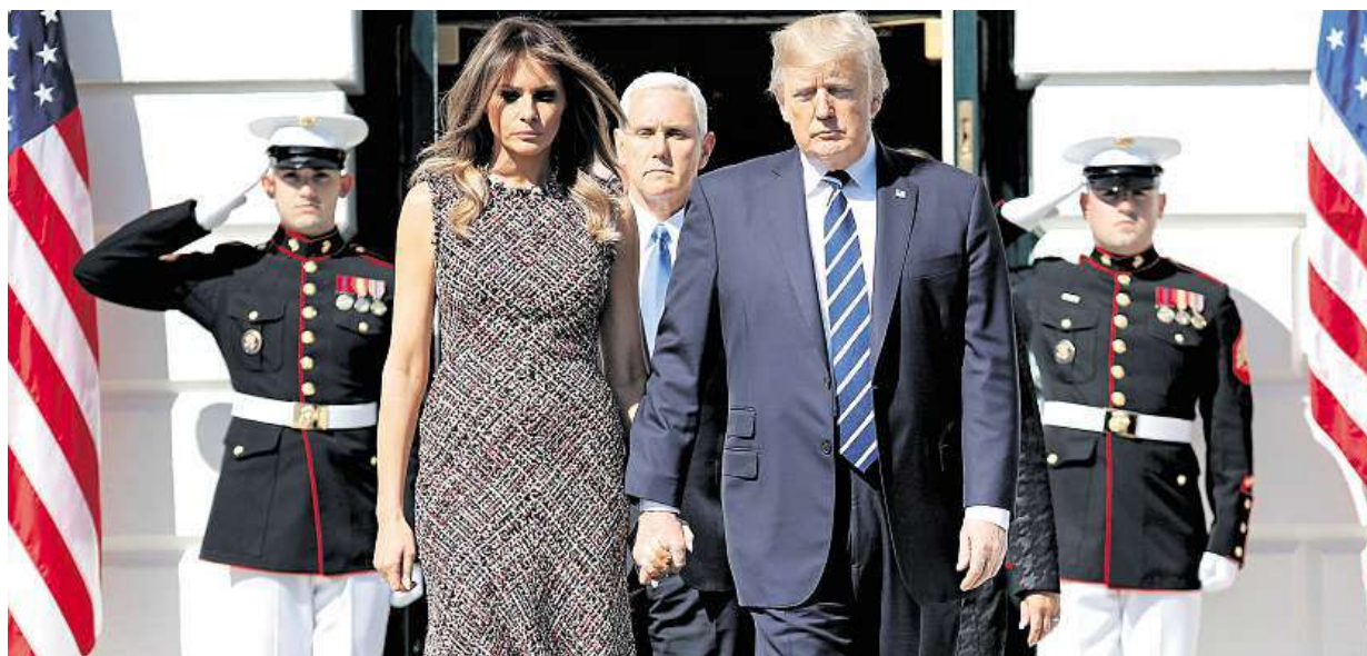
Za akt čirého zla označil americký prezident Donald Trump střelbu v nevadském Las Vegas. Vyjádřil soustrast obětem.

Masakr na koncertě. V Las Vegas přišlo o život nejméně 58 lidí, dalších více než pět stovek je zraněných. Pachatel. Zastřelil se ještě před příchodem policie. Důvod. Útok zatím nebyl označen za teroristický STRANA 8