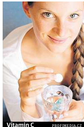
Vitamin C

Lidský organismus nedokáže, až na výjimky, vitaminy vy-