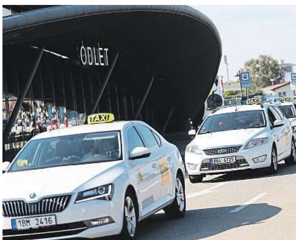
Taxikáři napřed pomalou jízdou hodiny blokovali cestu na letiště (vlevo), poté se přesunuli před magistrát (vpravo).

Protest několik hodin komplikoval provoz u Letiště Václava Havla v Ruzyni, policisté tak řešili případy bezdůvodně pomalé jízdy. „Taková forma nátlaku je nepřijatelná! Teď jedou do centra, přitom slíbili, že to neudělají,“ komentovala včerejší dění pražská primátorka Adriana Krnáčová na svém twitterovém účtu poté, co taxikáři oznámili, že se z okolí letiště přesouvají k magistrátu. Na Mariánském náměstí troubili úředníkům pod okny, i zde padaly pokuty. K protestům se nepřipojily dispečinky Taxi Praha