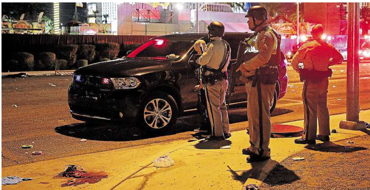
Policisté hlídají v Las Vegas nedaleko místa, kde útočník střelil na posluchače koncertu.

• 13 mrtvých (5. 11. 2009) – Masakr na základně armády v texaském Fort Hoodu měl na svědomí major a armádní psychiatr Nidal Malik. V roce 2013 byl odsouzen k trestu smrti.