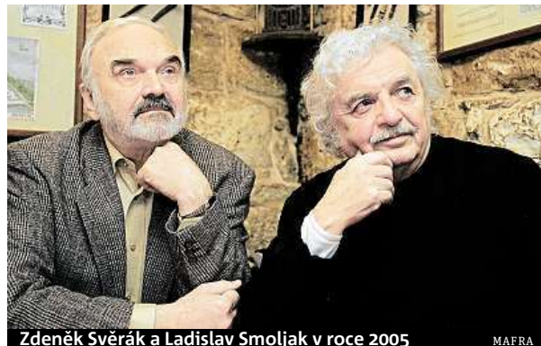
Zdeněk Svěrák a Ladislav Smoljak v roce 2005

Historicky prvním představením divadla bylo uvedení hry Akt v sále Malostranské besedy.