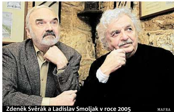
Zdeněk Svěrák a Ladislav Smoljak v roce 2005

Historicky prvním představením divadla bylo uvedení hry Akt v sále Malostranské besedy.