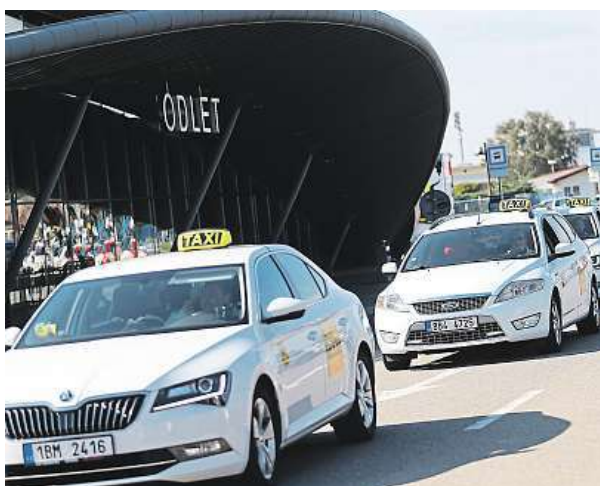
Taxikáři napřed pomalou jízdou hodiny blokovali cestu na letiště (vlevo), poté se přesunuli před magistrát (vpravo).