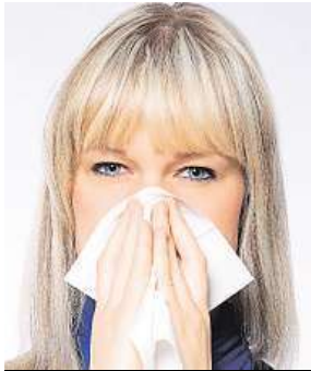
Ani rýmu nepodceňujte!

Navzdory tomu, že očkování snižuje počet pracovních