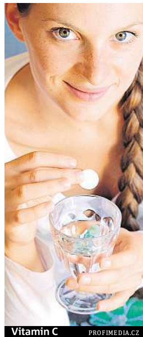
Vitamin C

„V lékárně nám vitamín C může lékárník nabídnout i ve formě volně prodejného léčiva. Léčiva procházejí několikaletým zkoušením. Výsledkem jsou účinné koncentrace, maximální jednotlivé dávky, maximální dávky pro celý den, ča-