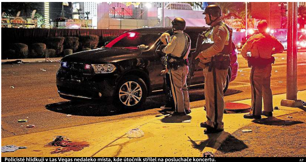
Policisté hlídají v Las Vegas nedaleko místa, kde útočník střílel na posluchače koncertu.

• 13 mrtvých (5. 11. 2009) – Masakr na základně armády v texaském Fort Hoodu měl na svědomí major a armádní psychiatr Nidal Malik. V roce 2013 byl odsouzen k trestu smrti.