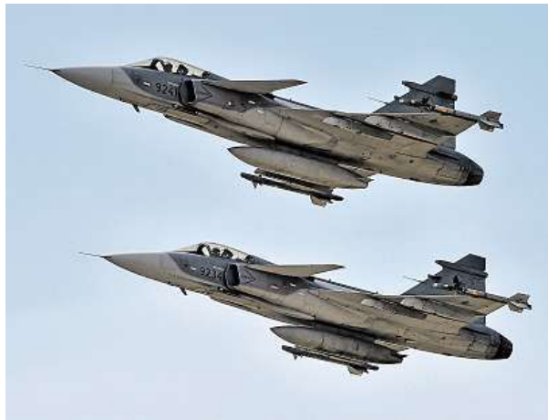
Diváci mohli spatřit také průlet stíhačů JAS-39 Gripen. ČTK

Přes 18 tisíc diváků sledovalo v sobotu vojenské vrtulníky, ale i historickou techniku.