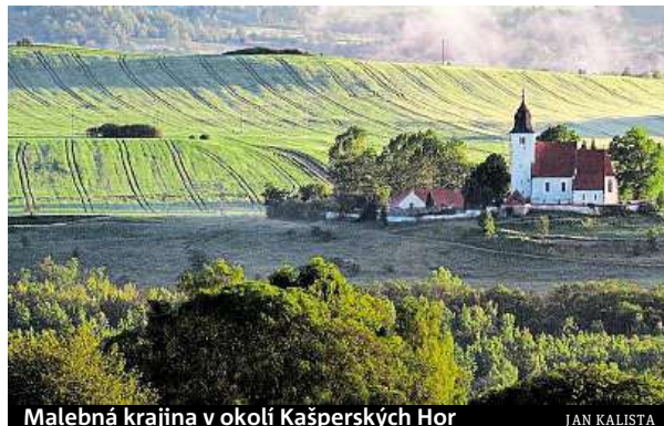
Malebná krajina v okolí Kašperských Hor