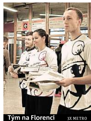
Tým na Florenci 3X METRO

V deníku Metro měly již třikrát možnost se prezentovat sportovní oddíly. Prvním z nich byly hráčky amerického fotbalu Harpyje z Hostivaře, druhým házenkářky z Kobylis a třetím frisbee tým Terrible Monkeys. Hráči potom na vybraných stanicích metra ráno hodinu rozdávali deník Metro s reportáží napsanou právě o nich. Redakci se zatím sešlo několik nabídek. Redaktoři budou oddíly a kluby postupně navštěvovat a zajímavosti z jejich sportovního života zpracovávat. Do konce týdne můžete své nabídky ještě zasílat na mailovou adresu pavel.urban@metro.cz .