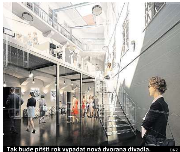
Tak bude příští rok vypadat nová dvorana divadla. DNZ

Rekonstrukce domovské scény přivedla soubor Divadla Na zábradlí na druhý břeh Vltavy – od září hostuje na jevišti smíchovského Švandova divadla. Kromě již zmíněného hostování čeká soubor divadla účast na několika zahraničních festivalech a řadu představení odehraje také na zájezdech. Mezitím podle Wolfa nechá město provizorně upravit prostory Divadla Komedie tak, aby se do něj herci ze Zábradlí mohli od začátku roku 2017 dočasně přesunout. ROW