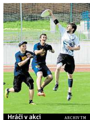
Hráči v akci

Více o frisbee a Terrible Monkeys se dočtete v článku na stránkách www.metro.cz nebo přímo na internetových stránkách týmu www.terrible-monkeys.cz .