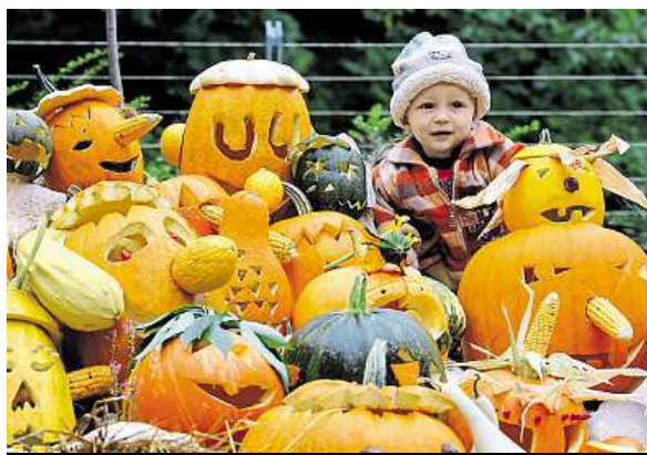
Přichází doba vyřezávání dýní. MAPRA

• 5. října. Procházka na téma Rozvoj Prahy v 19. století. Jak se v běhu času změnila Praha a co nejvíce tuto změnu ovlivnilo. Sraz je v 15.30 hodin na Výtoni u Podskalské celnice. Nutná je rezervace, a to přes e-mail: schneider@architectureweek.cz.