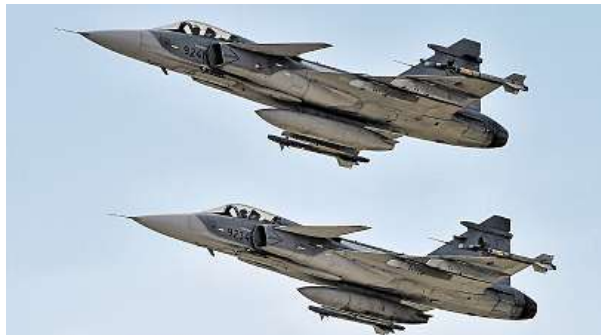
Diváci mohli spatřit také průlet stíhačů JAS-39C Gripen.

Lidé viděli v akci bojové vrtulníky základny, ale také historickou techniku. Letové ukázky odstartoval průlet stíhacích letounů JAS-39 Gripen. Ve vzduchu pak lidé vi-