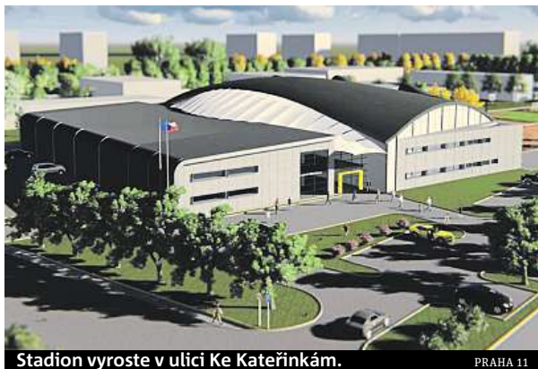
Stadion vyroste v ulici Ke Kateřinkám.

„Jedná se o zásadní opatření, které povede ke snížení stávající hlukové zátěže a to i za předpokladu zvýšeného pohybu vozidel,“ píše se v do-