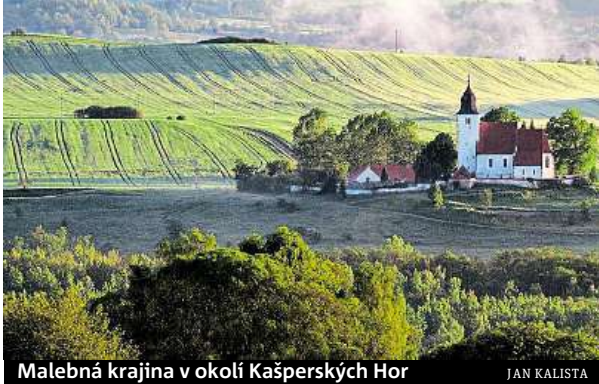
Malebná krajina v okolí Kašperských Hor