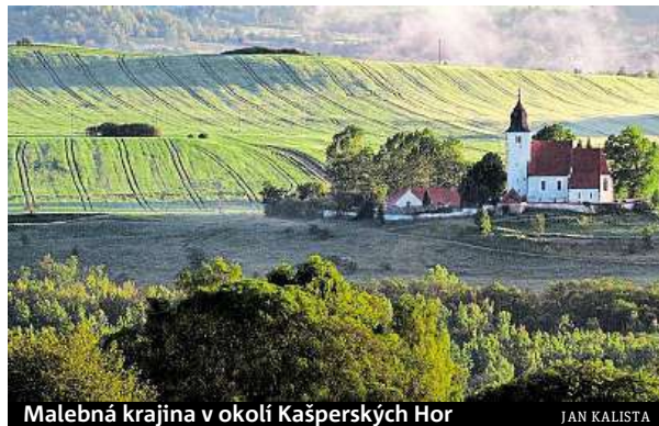
Malebná krajina v okolí Kašperských Hor