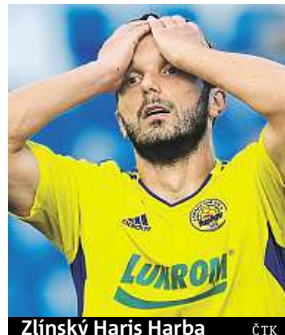
Zlínský Haris Harba

Na první místo v době uzávěrky tohoto vydání poskočila Mladá Boleslav. Ač se proti Dukle trápila, dokázala v závěru skórovat ze své jediné přímé střely na bránu. Středočechy mohla na 1. místě vystřídat Plzeň. Ta zápas proti Hradci hrála až včera večer. SIM