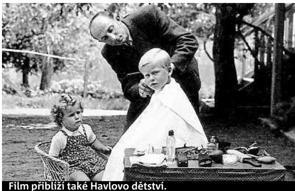
Film přiblíží také Havlovo dětství.

Film pojala neobvyklým způsobem – žádní pamětníci ani historici, hlavním vypravěčem je přímo Václav Havel. Portrét Havla vznikl jako historicky první mezinárodní koprodukce České televize a francouzsko-německé televize Arte. V Česku se dostane do kin 20. listopadu. METRO