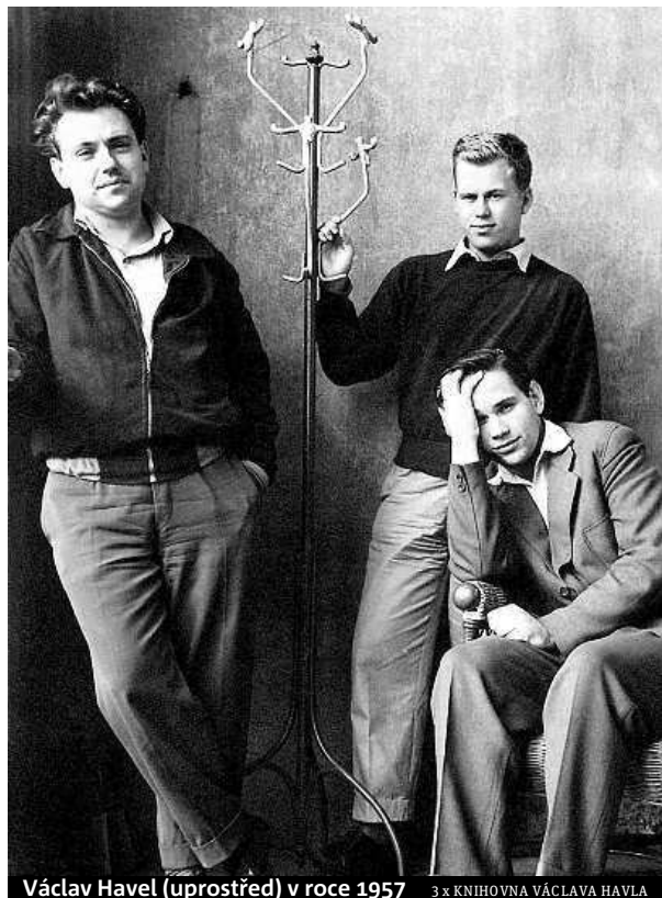
Václav Havel (uprostřed) v roce 1957 3 x KNIHOVNA VÁCLAVA HAVLA