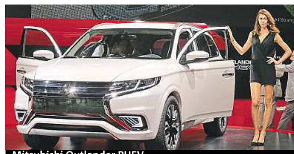
Mitsubishi Outlander PHEV