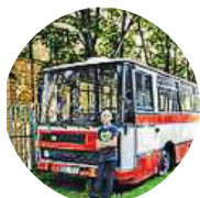
Petr Jelínek Já jsem rozhodně pro Invalidovnu.