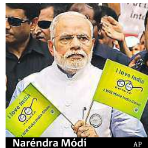
Naréndra Módí

Indický premiér Naréndra Módí se včera chopil koštěte a připojil se k milionům školáků, úředníků a dalších radozvěrných občanů, kteří vyšli uklízet špinavé ulice, parky i veřejné budovy. Předseda vlády tímto zahájil celostátní kampaň, jejímž cílem je napravit pověst Indie jako jedné z nejšpinavějších zemí světa. Kampaň má trvat pět let. ČTK