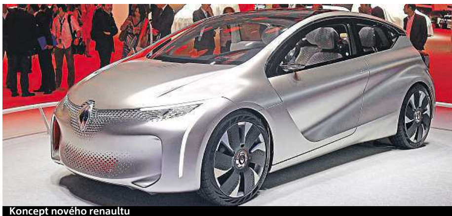
Koncept nového renaultu

Jednodenní vstupenka na autosalon, který se veřejnosti otevře zítra, stojí 14 eur. čTK