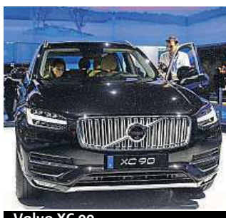
Volvo XC 90