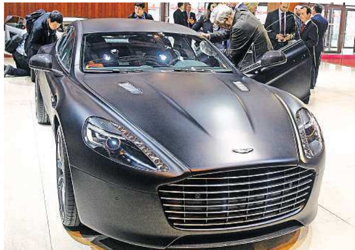
Lamborghini Asterion LPI 910-4 AT a Aston Martin Rapide S