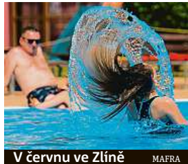
V červnu ve Zlíně MAFRA

zvolna klesat, ale zůstat blízko dlouhodobým průměrům. Dlouhodobá průměrná teplota pro období mezi 30. srpnem a 26. zářím je 14,5 stupně Celsia.