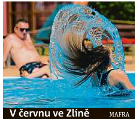
V červnu ve Zlíně MAFRA

zvolna klesat, ale zůstat blízko dlouhodobým průměrům. Dlouhodobá průměrná teplota pro období mezi 30. srpnem a 26. zářím je 14,5 stupně Celsia.