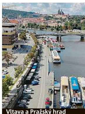
Vltava a Pražský hrad