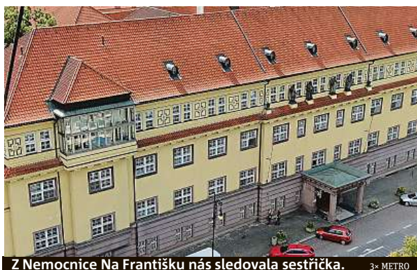
Z Nemocnice Na Františku nás sledovala sestřička.