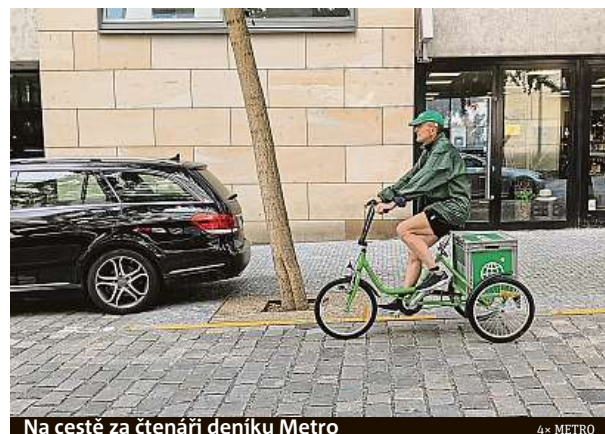
Na cestě za čtenáři deníku Metro