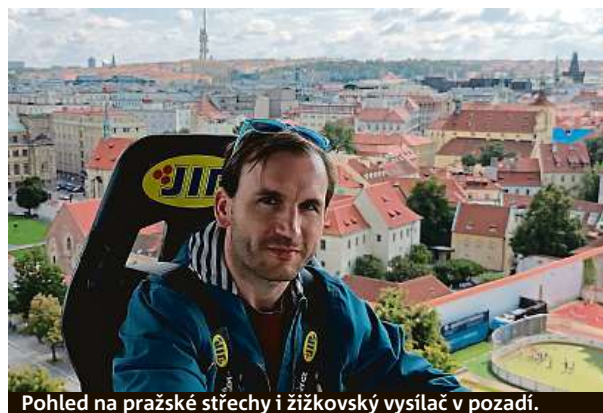
Pohled na pražské střechy i žižkovský vysílač v pozadí.

Oběd v oblacích vyjde na 2190 korun, za večeři hosté zaplatí 3380 korun. Za tu při západu slunce o něco více. PUR