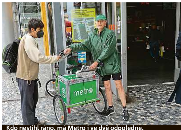
Kdo nestihl ráno, má Metro i ve dvě odpoledne.