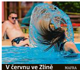
V červnu ve Zlíně MAFRA

zvolna klesat, ale zůstat blízko dlouhodobým průměrům. Dlouhodobá průměrná teplota pro období mezi 30. srpnem a 26. zářím je 14,5 stupně Celsia.