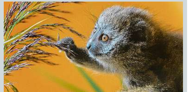
Plzeňské mládě lemura

Mailo. Tak se jmenuje nové nejmladší mládě kriticky ohroženého mada-gaskarského primáta lemura rákosového, které se narodilo v červenci v plzeňské zoologické zahradě. Lemury rákosové chová plzeňská zoo jako jediná v Česku od roku 2008. Přírodní prostředí těchto zvířat na Madagaskaru se kvůli rozšiřování rýžových polí neustále zmenšuje. ČTK