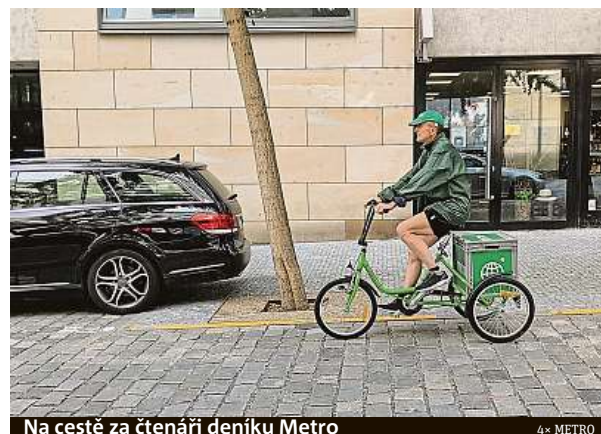
Na cestě za čtenáři deníku Metro