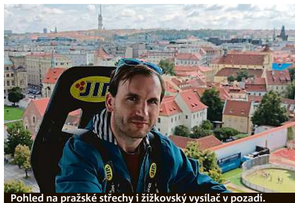
Pohled na pražské střechy i žižkovský vysílač v pozadí.

Oběd v oblacích vyjde na 2190 korun, za večeři hosté zaplatí 3380 korun. Za tu při západu slunce o něco více. PUR