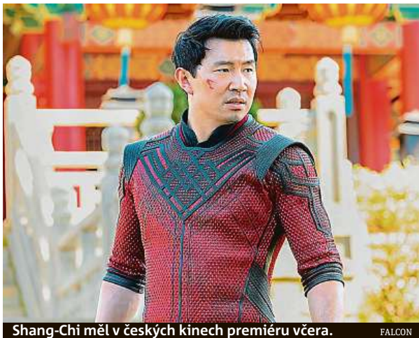
Shang-Chi měl v českých kinech premiéru včera.

Pokud bych snímek hodnotil jako v klasické recenzi, Shang-Chi by si u mě vykopal tři hvězdičky z pěti. Jeho filmové dobrodružství je totiž plné rozporů, které mohou