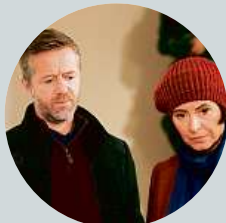
20:00 Labyrint III (1/7) Krimiseriál (ČR, 2018)