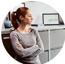
20:20 Specialisté (47) Krimiseriál (ČR, 2018). V zábavním parku se ztratily dvě děti. Oddělení specialistů je povoláno kvůli podezření, že čin mohl spáchat biologický otec dětí, který s nimi má po rozvodu povolen pouze asistovaný styk. Hrají: D. Prachař, J. Štáfek, Z. Kajnarová, J. Zadražil, L. Krobotová a další