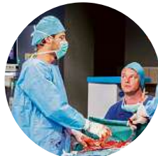
20:15 Modrý kód (114) Seriál (ČR, 2018). David kvůli naléhavé operaci nechává otce doma s ošetřovatelkou a jede do nemocnice. Stav profesora Hofbauera se zatím nečekáně zhorší. Hrají: S. Laurinová, M. Němec, R. Zach, I. Chmela a další