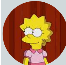
20:15 Simpsonovi XIV (15) Animovaný seriál (USA, 2002-2003)