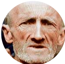
20:00 Po Hitlerovi (1/2) Pět poválečných let bylo poznamenáno dějinnými událostmi osvobození, založení Organizace spojených národů, norimberských procesů, Marshallova plánu a únorového puče v Československu