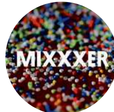
15:05 Mixxer Show Klipy na přání, soutěže, chat s hosty