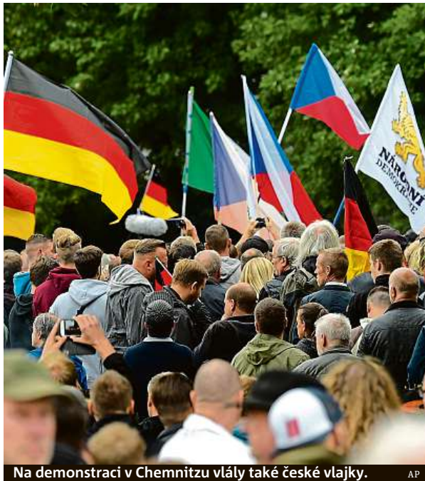
Na demonstraci v Chemnitzu vlály také české vlajky. AP

Během série demonstrací, které organizovalo pravicové hnutí Pro Chemnitz, protimigrační hnutí Pegida a parlamentní strana Alternativa pro Německo (AfD) i jejich odpůrci, policie zaznamenala zakázané poškozování majetku, ublížení na zdraví nebo užívání symbolů protiústavních organizací. ČTK