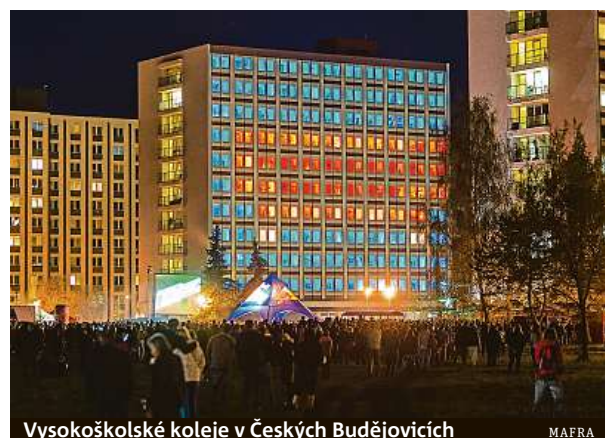
Vysokoškolské koleje v Českých Budějovicích