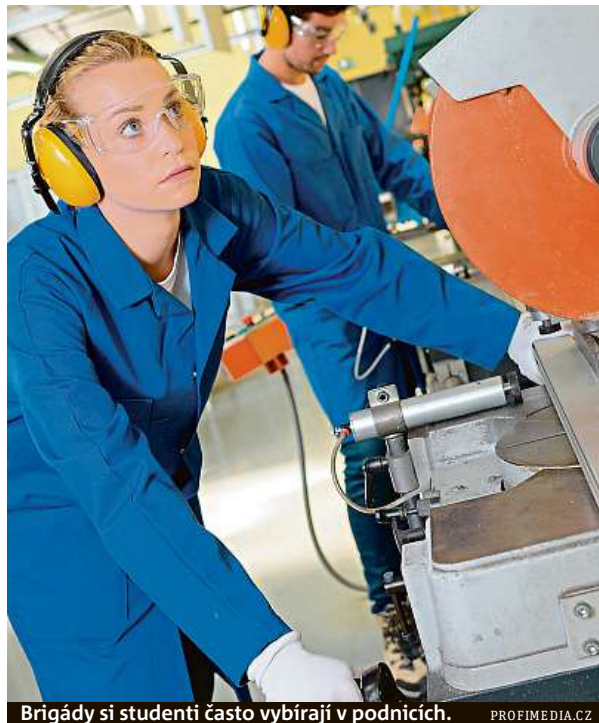
Brigády si studenti často vybírají v podnicích.

Ovšem i ty mohou být v oboru podnikových služeb placené anebo přínosné ji-