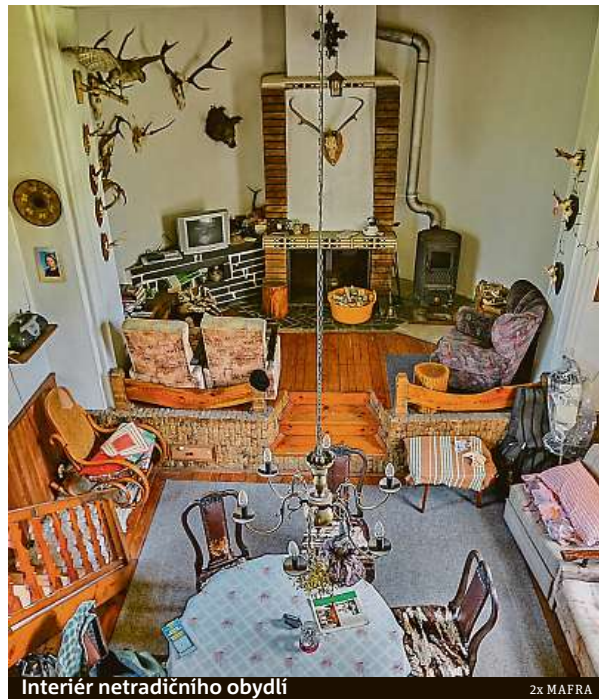
Interiér netradičního obydlí