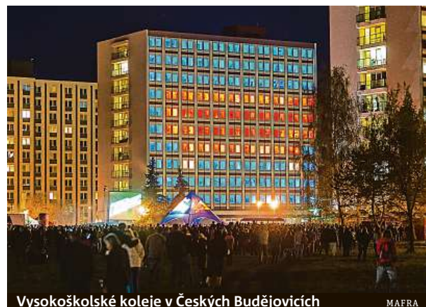
Vysokoškolské koleje v Českých Budějovicích.