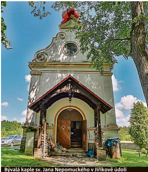
Bývalá kaple sv. Jana Nepomuckého v Jiříkově údolí

Červené blato patří k nejzajímavějším přírodním rezervacím v České republice. Chrání jedno z nejnámějších a nejlépe přístupných rašeliníšť Třeboňska. Stezka často vede po dřevěných povalových chodníčcích. MET