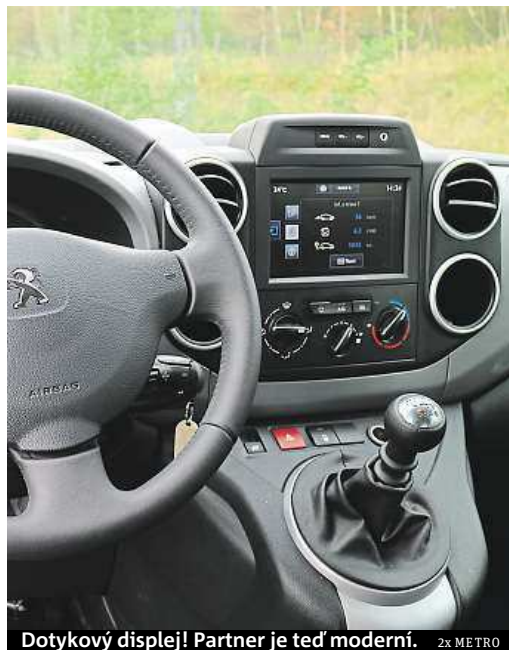
Dotykový displej! Partner je teď moderní. 2x METRO