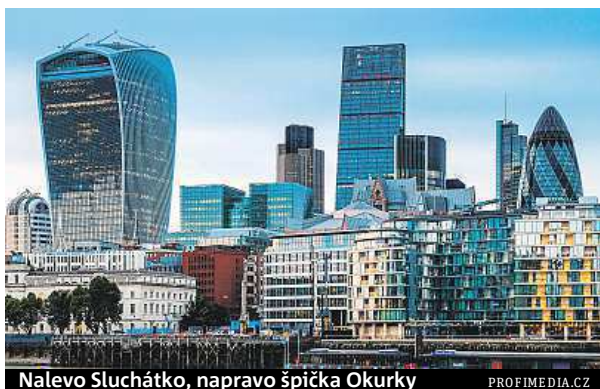
Nalevo Sluchátko, napravo špička Okurky

Sluchátko jako každá moderní budova totiž nejen rozděljuje obyvatelstvo na dva tábory, ale způsobuje lidem v okolí i problémy. Jeho vyduťtý tvar má za následek, že skla v oknech fungují jako obrovské zrcadlo, které v okolí zvyšuje teplotu o více než dvacet stupňů. Už při stavbě mrakodrapu v roce 2013 dokázaly sluneční paprsky odrážející se od budovy v přílehlé ulici usmažit vajíčko a roztavit část luxusního jaguáru. To