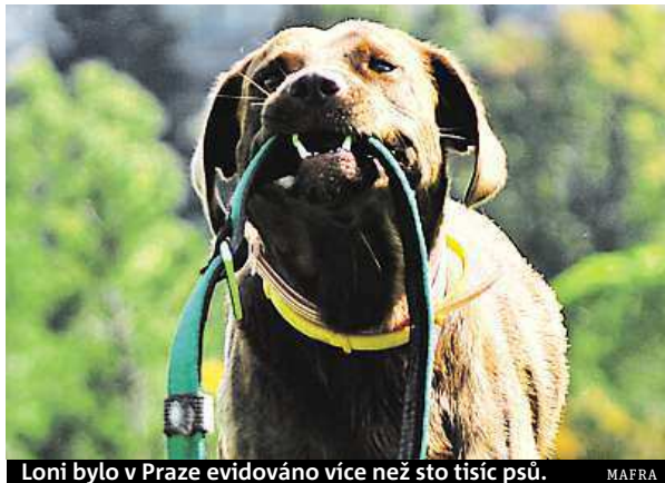
Loni bylo v Praze evidováno více než sto tisíc psů.

„Do té doby, než proběhne legislativní kolečko na magistrátu, bude možné přílohu vyhlášky s místy pro volný pohyb psů ještě měnit,“ říká Zdeněk Pokorný, radní pro bezpečnost Prahy 4. Své návrhy míst, kam by měla radnice psy bez vodítka pouštět, přitom obyvatelé čtyřky mohou posílat ješ-