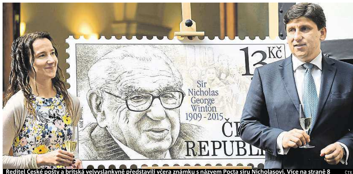
Reditel České pošty a britská velvyslankyně představili včera známku s názvem Pocta siru Nicholasovi. Více na straně 8

Co vadilo. Stížnosti se týkaly hlavně ubytování. Prkotiny. Češi řeší i bizarní věci jako třeba málo kreativní práci s ručníky. Uprchlíci. Obavy z nich panují hlavně před dovolenou, předmětem reklamaci nebyli STRANA 6