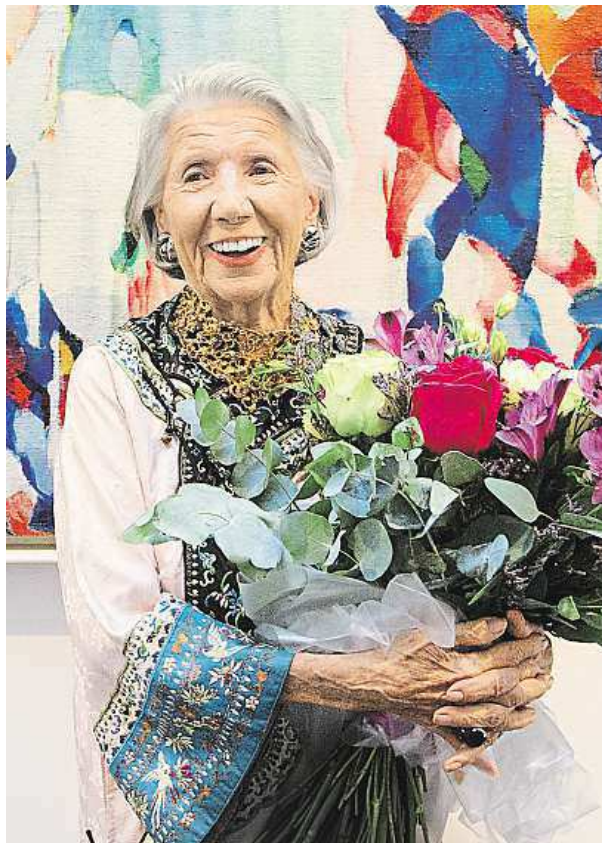
Mecenáška slaví neuvěřitelné 96. narozeniny.

Velký potenciál úspor skýtá také kvalitní regulace otopného systému. Starý termostat můžete vyměnit za moderní řídicí jednotku, která vám umožní nastavit stálou a pohodlnou denní i noční teplotu. Úsporu energií zajistí také ekvitermní regulace, tedy řízení otopné soustavy na základě vnější teploty vzduchu. K pohodlí obyvatel domu pak přispěje možnost dálkového ovládní kotle přes mobilní telefon či internet.