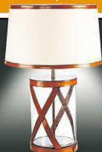
Stolní lampa Balmuir