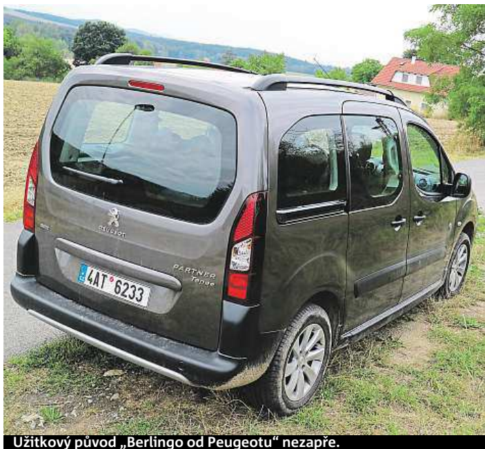
Užitkový původ „Berlingo od Peugeotu“ nezapře.