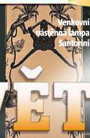
Venkovní nástěnná lampa Santorini