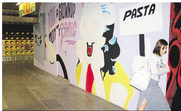
Don't panic. Angličtina nechybí ani na Můstku. METRO

Čmáranice. Bílá barva. Básničky. Graffiti. A znovu čmáranice... Zeď, která chrání stavbu výtahu v metru na Andělu, je bojištěm. Vandalové s fixou ničí kresby umělců a dopravní podnik zas a znovu vzkazy přetírá. Nově se na jeho povel graffiti objevily už i na zdi ve stanici Můstek.