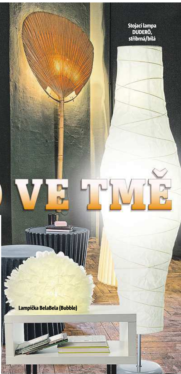
Lampička BelaBela (Bubble)

Lampička obvykle slouží jako lokální zdroj světla pro čtení nebo práci, případně jako doplňkový zdroj pro pohodu a atmosféru. Může být obyčejná, ale může to být designový skvost. Materiálové provedení je neuvěřitelně široké, od dřeva nebo kovu, přes papír, až ke sklu a kameni, ale používá se i textil, umělé hmoty, proutí, beton... v podstatě cokoliv.