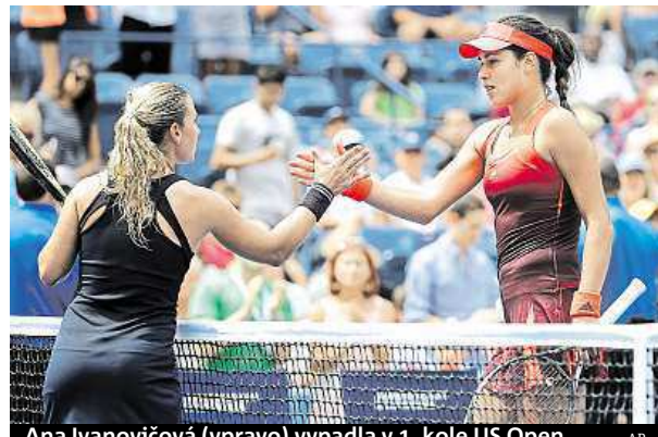
Ana Ivanovičová (vpravo) vypadla v 1. kole US Open.

jedničky Sereně Williamsově z USA zdravotně v pořádku. V prvním setu dostala kanára a ve druhém za stavu 0:2 zápas kvůli bolestem levé nohy skrečovala. Na kurtu se zdržela jen 27 minut, ale vyinkasovala odměnu 39 500 dolarů (947 tisíc korun). Později ale zveřejnila fotku s chodící ortézou na noze a napsísem: „Těžko si představit, že US Open skončí takhle špatně.“