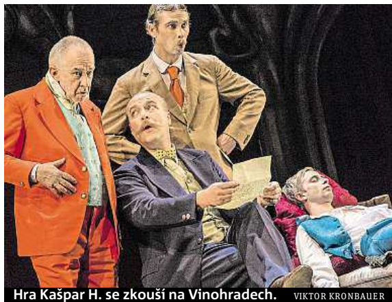
Hra Kašpar H. se zkouší na Vinohradech. VIKTOR KRONBAUER