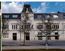
EFI SPA Hotel**** Superior & Pivovar