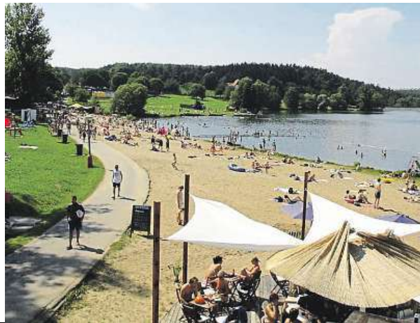
Hostivařské přehradě nepomohlo ani velké odbahnění. Kvalita vody vrtá hlavou nejen provozovatelů.