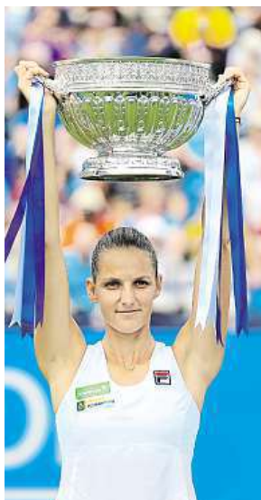
S vítěznou trofejí