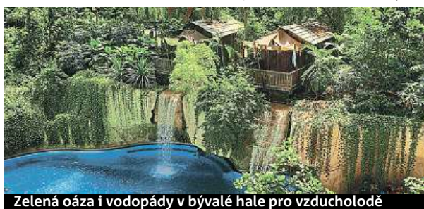
Zelená oáza i vodopády v bývalé hale pro vzducholoď

Kola, brusle, jeze- ra, nej koupaliště v Evropě i půl kilo- metru dlouhé rypadlo.