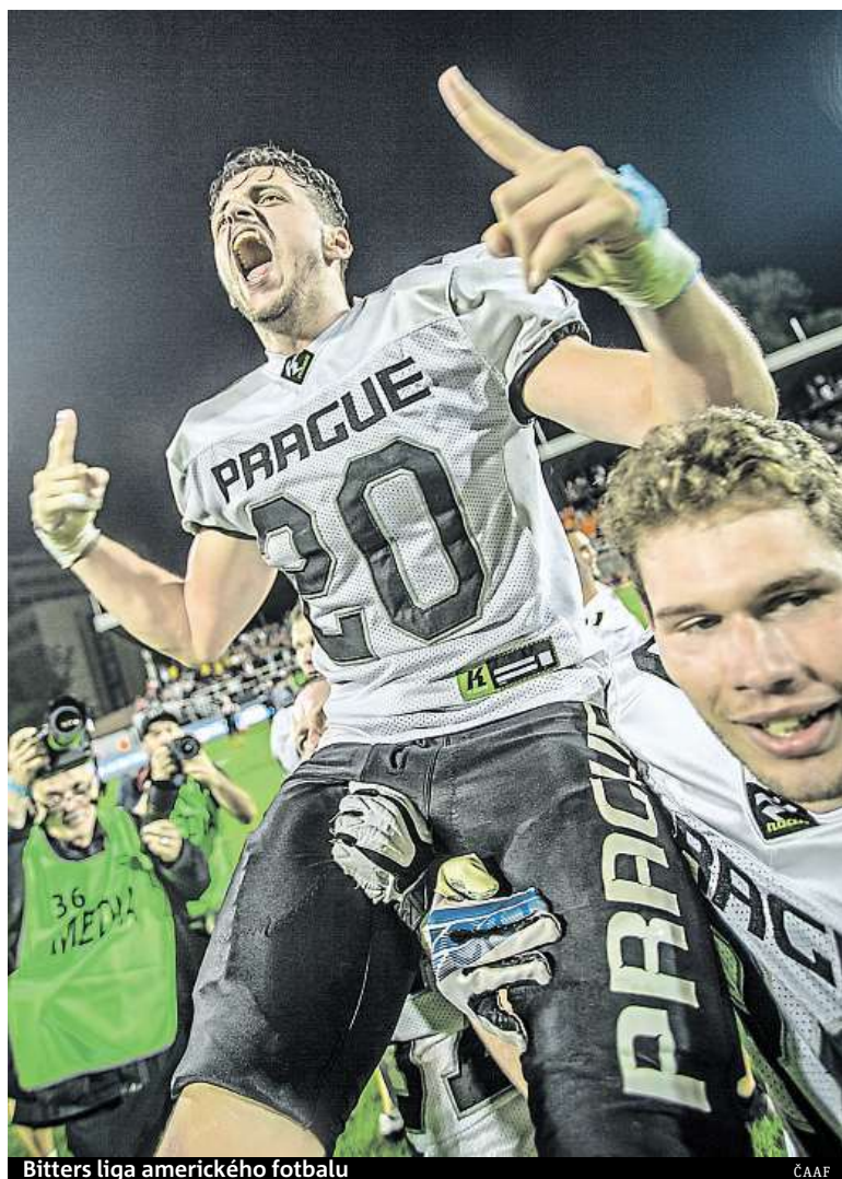
Bitters liga amerického fotbalu