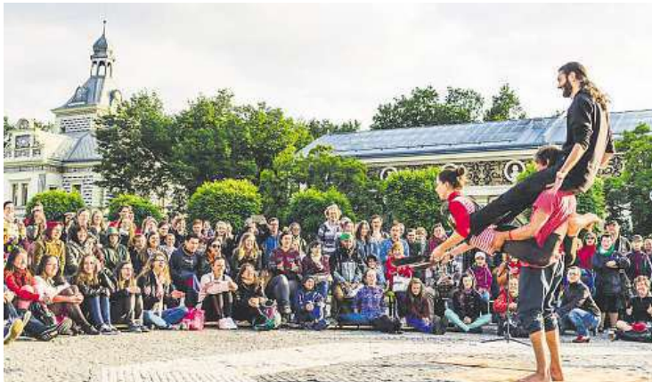
Jednou z největších akcí zdarma bude festival Za dveřmi.

Červenec v Praze. Deník Metro přináší přehled nejzajímavějších akcí