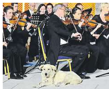
Přišel a poslouchal.

Hvězdou sociálních sítí se tento týden stal v Turecku hudbymilovný pes. Na mezinárodním hudebním festivalu v Izmiru vyšel na jeviště, právě když Vídeňský komorní orchestr pod taktovkou Svěda Oly Rudnera hrál Mendelssohnovu Čtvrtou symfonii. Z videa, které obletělo sociální sítě, je patrné, že hudba ani sál plný lidí psa nijak nevzrušily, protože po krátké, váhavé pouti napříč pódium zvolil nohy jednoho z houslistů a u nich se usadil čelem do publika. Hudebník se neubrnil smíchu, k němuž se okamžitě přidali diváci a připojili nadšený potlesk. Turecký pianista Fazıl Say, který se festivalu v Efezu v provincii