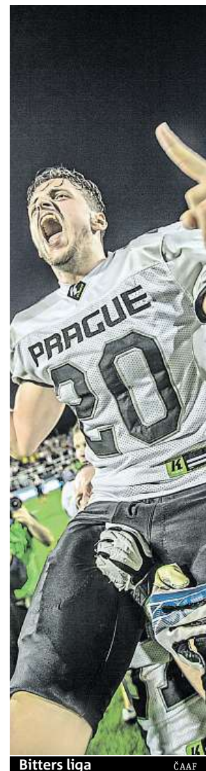
Bitters liga ČAAF