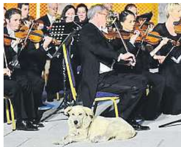
Přišel a poslouchal.

Hvězdou sociálních sítí se tento týden stal v Turecku hudbymilovný pes. Na mezinárodním hudebním festivalu v Izmiru vyšel na jeviště, právě když Vídeňský komorní orchestr pod taktovkou Svěda Oly Rudnera hrál Mendelssohnovu Čtvrtou symfonii. Z videa, které obletělo sociální sítě, je patrné, že hudba ani sál plný lidí psa nijak nevzrušily, protože po krátké, váhavé pouti napříč pódium zvolil nohy jednoho z houslistů a u nich se usadil čelem do publika. Hudebník se neubrnil smíchu, k němuž se okamžitě přidali diváci a připojili nadšený potlesk. Turecký pianista Fazıl Say, který se festivalu v Efezu v provincii