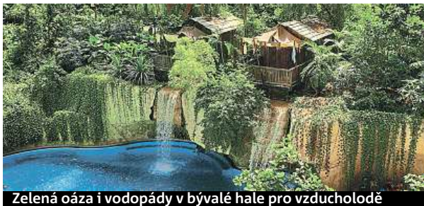
Zelená oáza i vodopády v bývalé hale pro vzducholoď

Kola, brusle, jeze- ra, nej koupaliště v Evropě i půl kilo- metru dlouhé rypadlo.