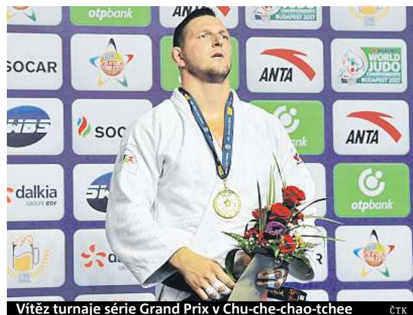
Vítěz turnaje série Grand Prix v Chu-che-chao-tchee ČTK

ně,“ řekl Krpálek po postupu do finále. „Ale jsem rád, že jsem se nakonec rozhodl jít, i když vím, že je pro mě mnohem důležitější následná příprava než tento turnaj,“ dodal. Nyní ho čeká v Číně třídní kemp a následně odletí s celým českým týmem na přípravu do Japonska. ČTK