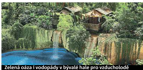
Zelená oáza i vodopády v bývalé hale pro vzducholodě

Kola, brusle, jeze- ra, nej koupaliště v Evropě i půl kilo- metru dlouhé rypadlo.