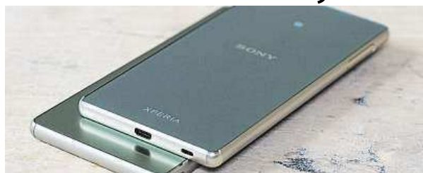
Změny u Sony Xperia Z3+ najdete uvnitř i vně.

Jak se nakonec ukázalo, většina těchto úniků informací byla mylná. Pravdou nakonec je jen označení Z4 pro Japonsko – u nás je tento mobil nabízen jako Z3+, což více odpovídá parametrům zařízení. Tvary i výbava vychází z původní Xperie Z3 a na první po-