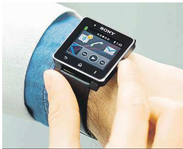
Baterie Sony SmartWatch 2 vydrží až tři dny.

Jednou z největších výhod SmartWatch je jejich zaměření. Zatímco konkurence se snaží do hodinek vměstnat celý telefon, stále nedokáže zabránit častému lovení mobilu v kapse a navíc zapomíná i na nejdůležitější funkci hodinek – zobrazování času.