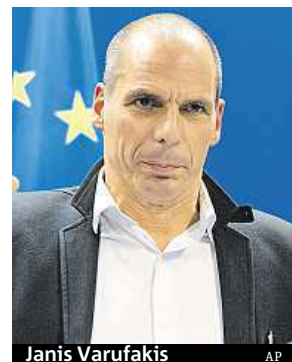
Janis Varufakis

chudí a důchodci, tedy ti, o kterých předseda vlády tvrdí, že je brání,“ říká v rozhovoru pro španělský deník bývalý řecký premiér Jorgos Papandreu. Současný ministr financí včera pro australský tisk oznámil, že pokud zvítězí „Ano“, mohla by vláda rezignovat. ONDŘEJ NEKOLA