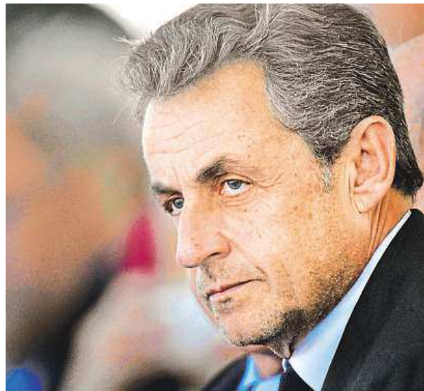
Obvinění může znamenat Sarkozyho definitivní konec.