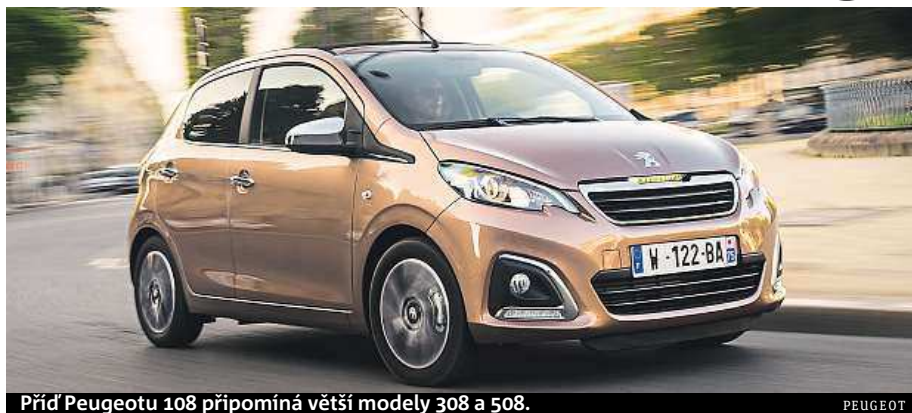
Příď Peugeotu 108 připomíná větší modely 308 a 508.

Příď Peugeotu 108 stejně jako u předchůdce připomíná větší modely značky, což působí stejně, jako když si malé dítě vezme oblek a společen-