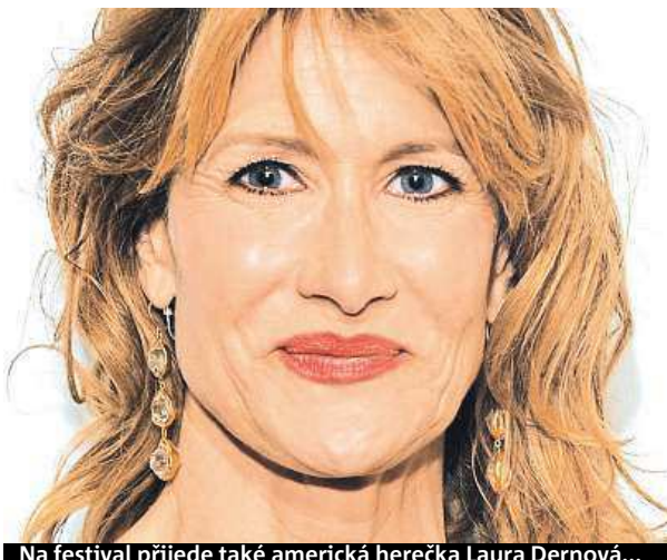
Na festival přijede také americká herečka Laura Dernová...

Další hvězdou letošního ročníku bude hollywoodská herečka Laura Dernová. Při příležitosti její návštěvy bude slavnostně uveden film Davida Lynche Zběsilost v srdci, v němž herečka vytvořila ústřední pár společně s Nicolaselem Cagem.