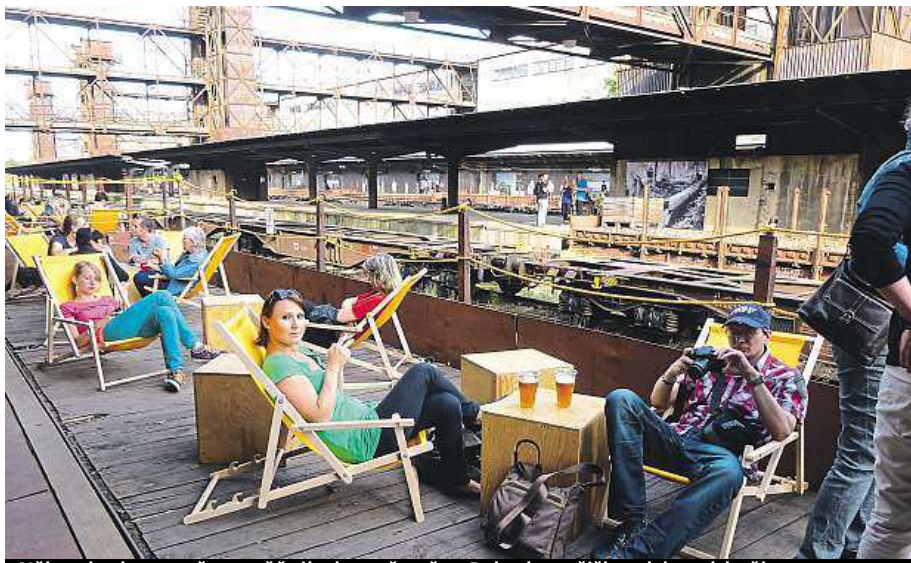
Některá místa se už proměňují, alespoň načas. Pohoda na žižkovském nádraží.