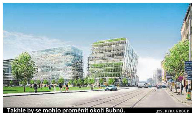
Takhle by se mohlo proměnit okolí Bubnů.