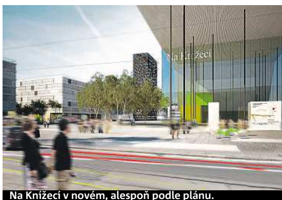
Na Knížecí v novém, alespoň podle plánu.