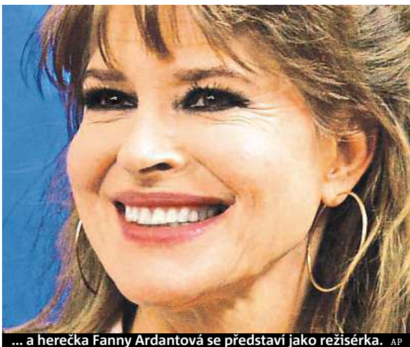
a herečka Fanny Ardantová se představí jako režisérka.