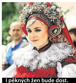
I pěkných žen bude dost.