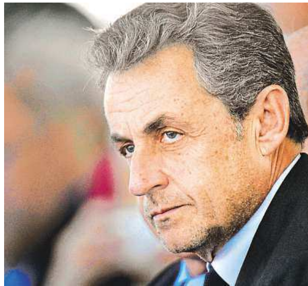
Obvinění může znamenat Sarkozyho definitivní konec.