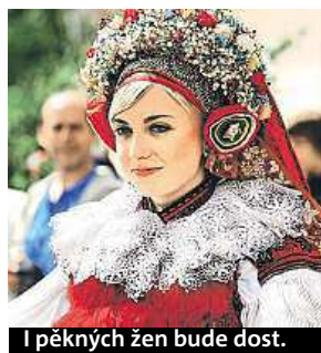
I pěkných žen bude dost.