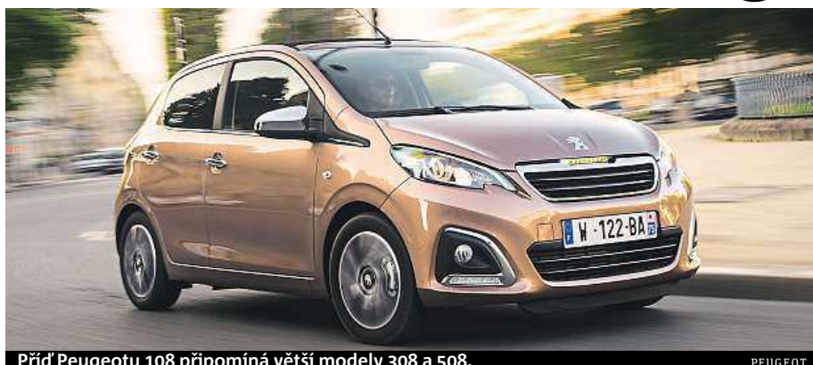
Přídí Peugeotu 108 připomíná větší modely 308 a 508.

Miniauto z Kolína jim vychází vstříc. Testovali jsme ho v Paříži a okolí.