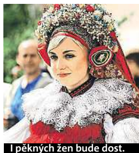
I pěkných žen bude dost.