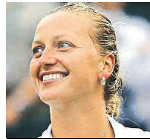
Petra Kvitová

Partačky z prostějovského klubu či fedcupové reprezentace na sebe dnes naráží v semifinále slavného Wimbledonu. Podle jejich trenérů rozhodne víra ve vlastní síly – tedy psychická odolnost.