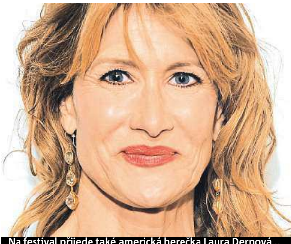
Na festival přijede také americká herečka Laura Dernová...

Další hvězdou letošního ročníku bude hollywoodská herečka Laura Dernová. Při příležitosti její návštěvy bude slavnostně uveden film Davida Lynche Zběsilost v srdci, v němž herečka vytvořila ústřední pár společně s Nicolaselem Cagem.