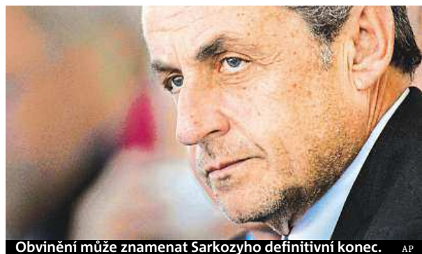
Obvinění může znamenat Sarkozyho definitivní konec.