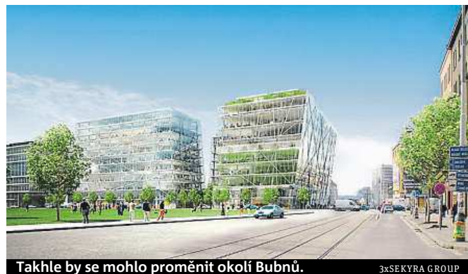
Takhle by se mohlo proměnit okolí Bubňů.