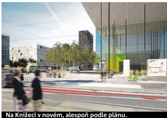
Na Knížecí v novém, alespoň podle plánu.