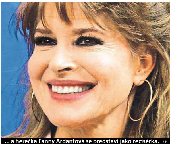
a herečka Fanny Ardantová se představí jako režisérka.