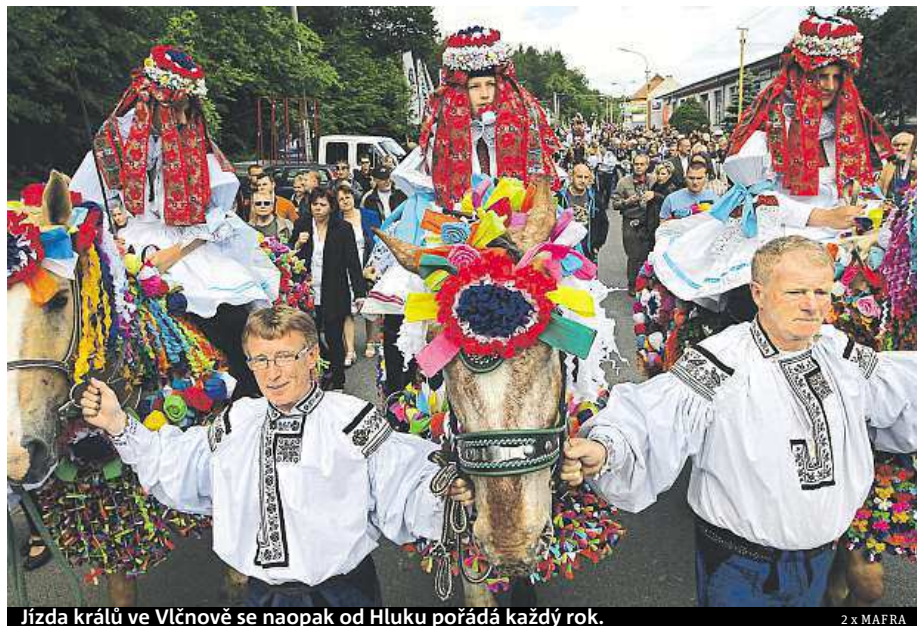
Jízda králů ve Vlčnově se naopak od Hluku pořádá každý rok.

Letos na sebe břímě králování vzali Libosvárovci. „Je to