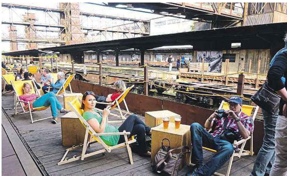
Některá místa se už proměňují, alespoň načas. Pohoda na žižkovském nádraží.