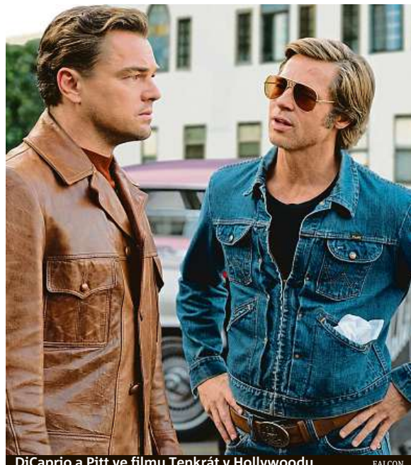
DiCaprio a Pitt ve filmu Tenkrát v Hollywoodu FALCON

• Poté se džínovka stala kulturním symbolem a byla zkrátka všude. Byla to také jedna z prvních unisexových položek šatníku vypadající dobře jak na mužích, tak na ženách (ve 40. letech v ní byla vyfocena Marilyn Monroe a prodejce šly rázem nahoru). Poté co denim zaplavil ulice, se do produkce podobných stylů vrhly i luxusní značka a džínová bunda se tak stala neodmyslitelnou, univerzální položkou našich šatníků.