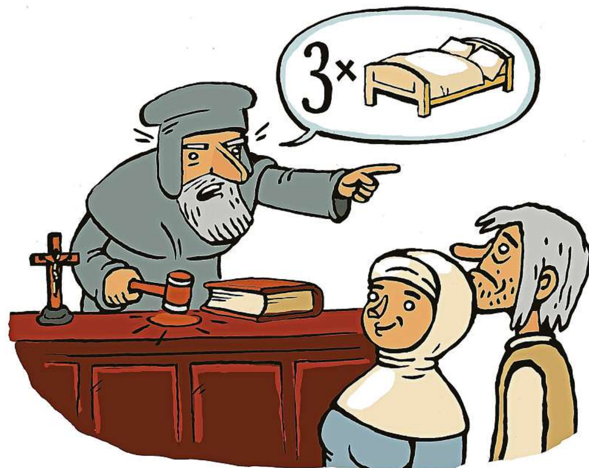
ILUSTRACE: HONZA SMOLÍK

Lidé spolu samozřejmě spali už před svatbou. Chlapi ženy sbalili na příslib manželství, což samozřejmě mnoho z nich zneužilo. Děti, které se narodily dříve než za devět měsíců po svatbě, byla podle Čechury v té době kvanta. Z této doby pochází také řada příruček, které radí, jak se milování s manželem vyhnout.