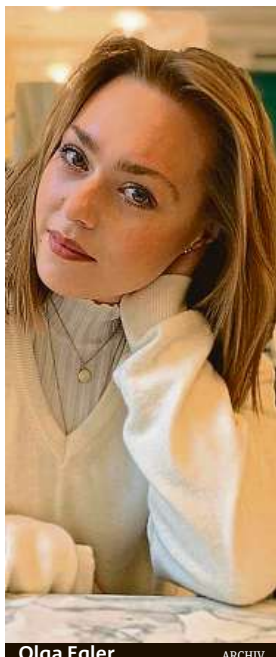
Olga Egler ARCHIV

Na rozdíl od džínové bundy je u kožené menší riziko „nesprávného“ výběru. Také z toho důvodu je podle Egler