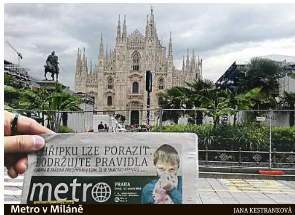
Metro v Miláně

Celkem nám do redakce přes mail nebo Instagram dorazilo skoro 50 fotek. Děkujeme za vaši přízeň. METRO