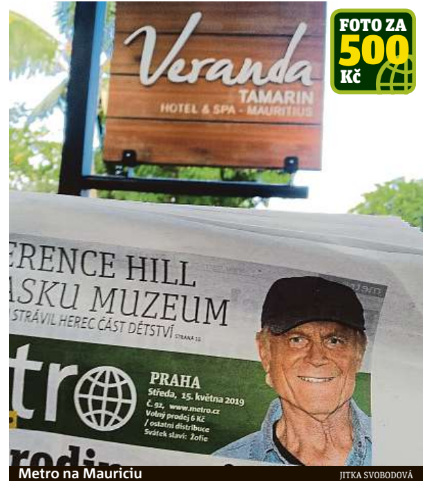
Metro na Mauriciu