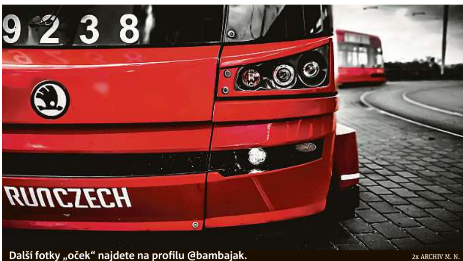
Další fotky „oček“ najdete na profilu @bambajak.