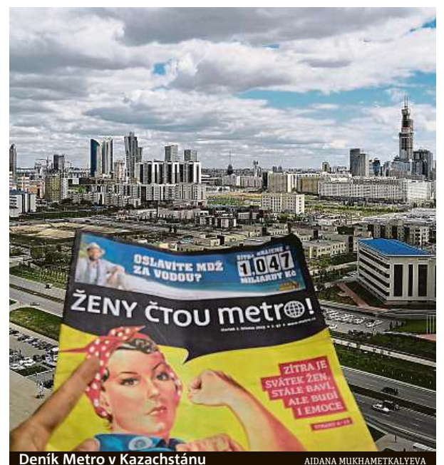
Deník Metro v Kazachstánu