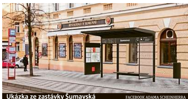
Ukázka ze zastávky Šumavská

První obrazovky jsou již k vidění uvnitř stanic či na zastávkách tramvají.