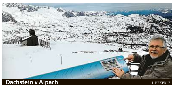
Dachstein v Alpách