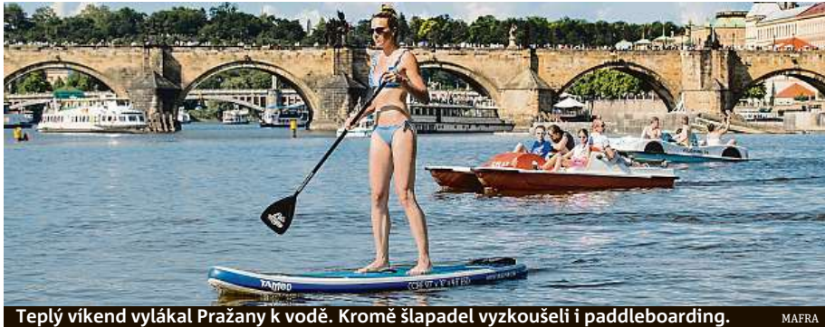
Teplý víkend vylákal Pražany k vodě. Kromě šlapadel vyzkoušeli i paddleboarding. MAIRA

V Biotopu Radotín zahájili sezonu bez ohledu na nízké