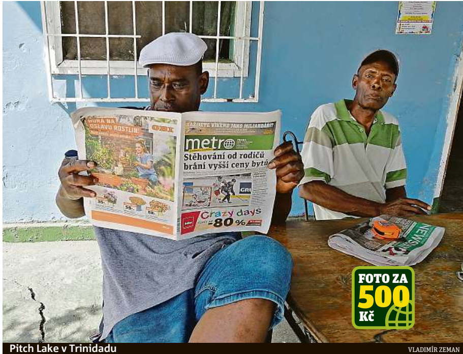
Pitch Lake v Trinidadu