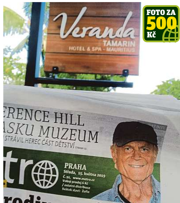
Metro na Mauriciu