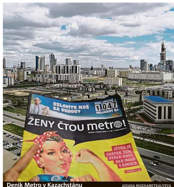
Deník Metro v Kazachstánu