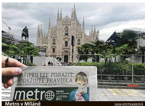
Metro v Miláně

Celkem nám do redakce přes mail nebo Instagram dorazilo skoro 50 fotek. Děkujeme za vaši přízeň. METRO