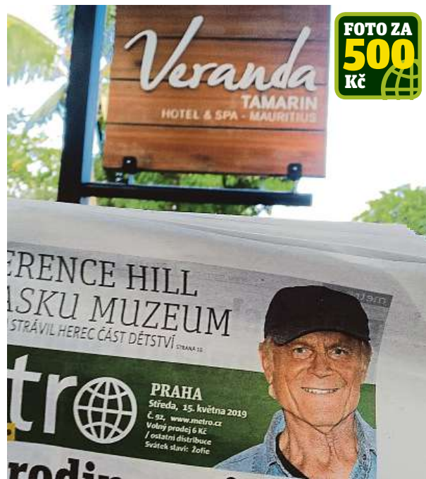
Metro na Mauriciu