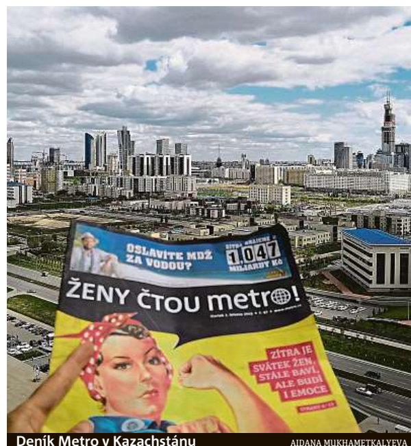
Deník Metro v Kazachstánu