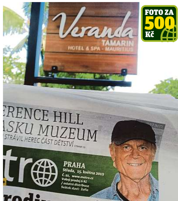
Metro na Mauriciu