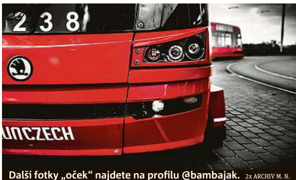
Další fotky „oček“ najdete na profilu @bambajak.