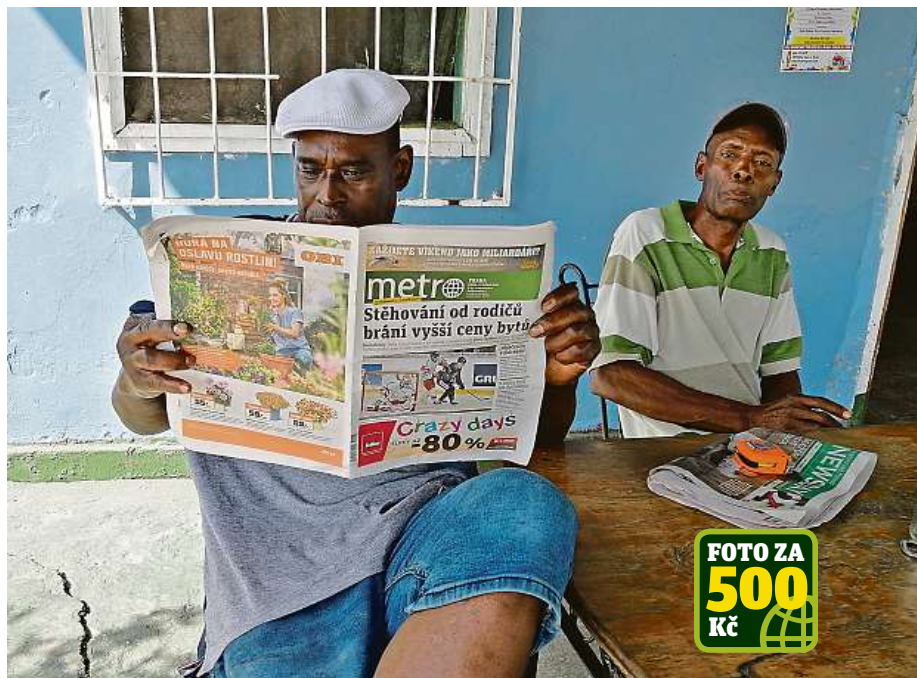
Pitch Lake v Trinidadu