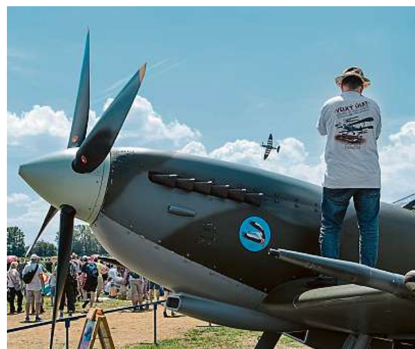
Na Aviatické pouti byl i letoun Supermarine Spitfire.