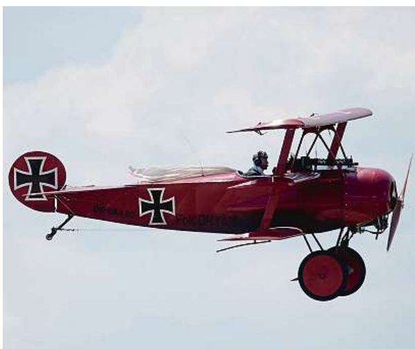
V Pardubicích byl k vidění i německý trojplášník Fokker Dr.I.