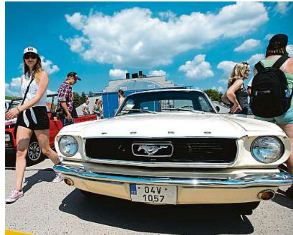
Na akci proběhla také výstava automobilových veteránů.