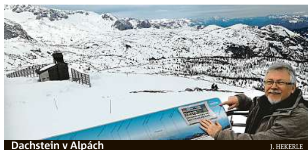
Dachstein v Alpách