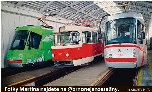
Fotky Martina najdete na @brnonejzenesaliny.