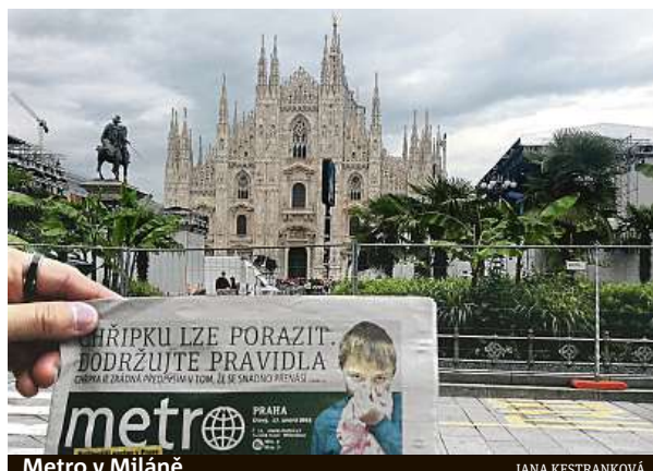
Metro v Miláně

Celkem nám do redakce přes mail nebo Instagram dorazilo skoro 50 fotek. Děkujeme za vaši přízeň. METRO