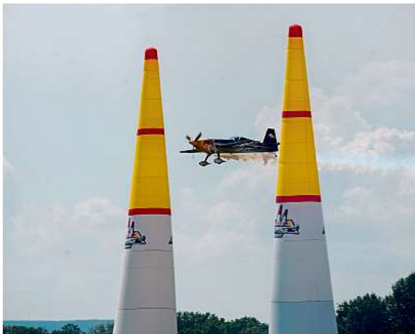
Ukázka strojů a průletů v rámci Red Bull Air Race Demo