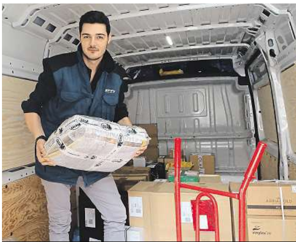
Hlavně opatrně, abychom zásilku nerozbili. 2x METRO

„Když si ráno rovnám do auta balíčky podle adres a jmen lidí, většinou už přesně vím, jak bude probíhat můj den,“ usmívá se Vořech. Zná ve svém rajonu nejen každou firmu, dům či skulinku na zaparkování, ale také většinu místních, kteří ho po desítkách zdraví i tehdy, když nese balík někomu jinému. „Budu od vás dneska něco brát,“ volá řidiči z auta na mladou paní, která s úsměvem přikyvuje. „Tak já se potom u vás zastavím,“ slibuje Vořech pozdější převzetí balíčku. Konverzace potvrzuje také svou teo-