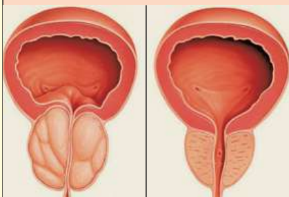
Zvětšená prostata, která brání normálnímu proudu moči