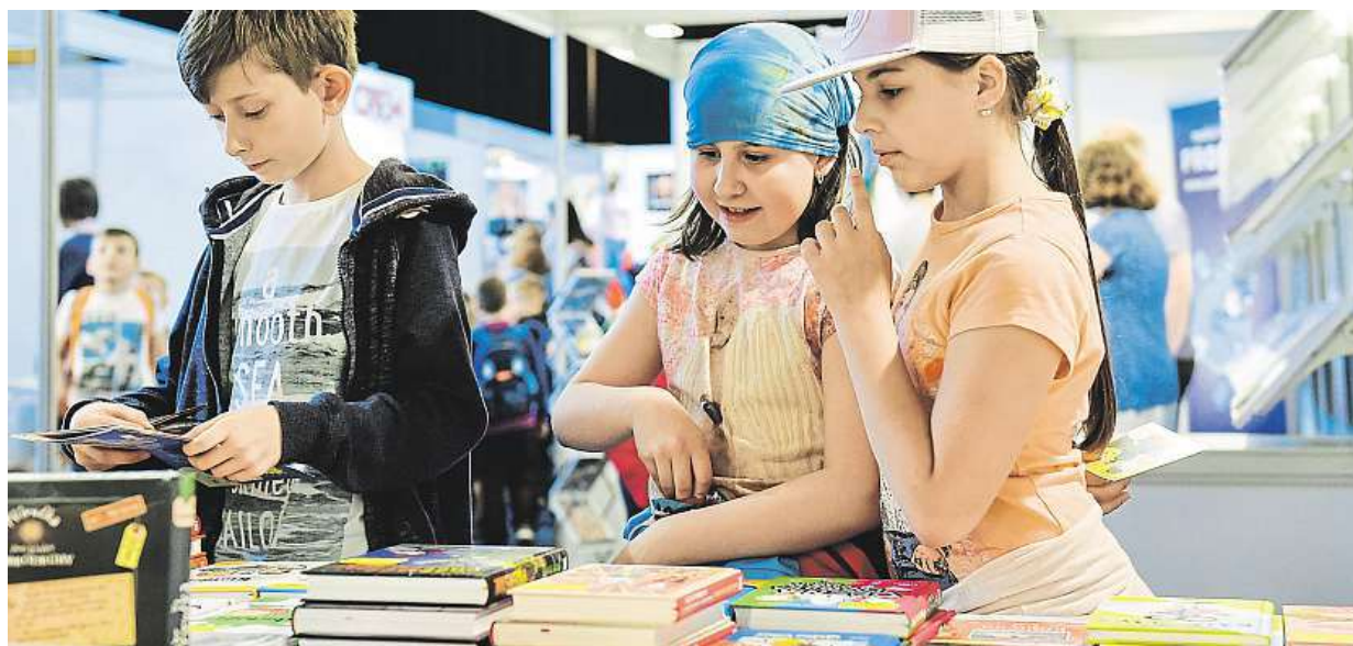
Třídenní veletrh dětské knihy včera začal v Liberci. V areálu Kolosea se letos představuje 26 vydavatelství a nakladatelství.

Superbouře. Hrozí čím dál častěji, navíc jsou extrémnější. Jak vznikají? Během dne se ohřeje vlhký vzduch. Přivaly vody. Rozvodní i malé řeky. Problémy. Krupobití a velké množství vody trápí třeba i Paříž STRANY 2 A 5