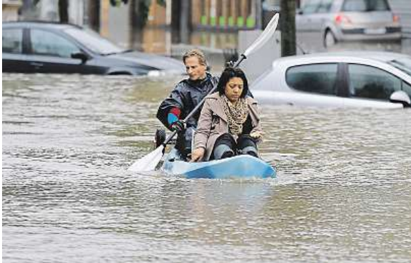
Lidé v Nemours jižně od Paříže se evakuují v kánoji.

Z bezpečnostních důvodů byla zastavena lodní doprava na Seině, některé ulice na pravém břehu byly uzavřeny pro auta. Úřady varovaly, že pokud hladina vystoupá 4,75 metru nad normál, budou muset uzavřít nadzemní dráhu RER C vedoucí po břehu Seiny. Potíže hlásí i další francouzská města. V městě Nemours v departementu Seine-et-Marne východně od Paří-