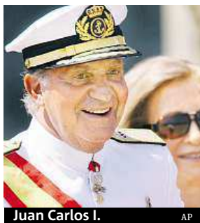
Juan Carlos I.