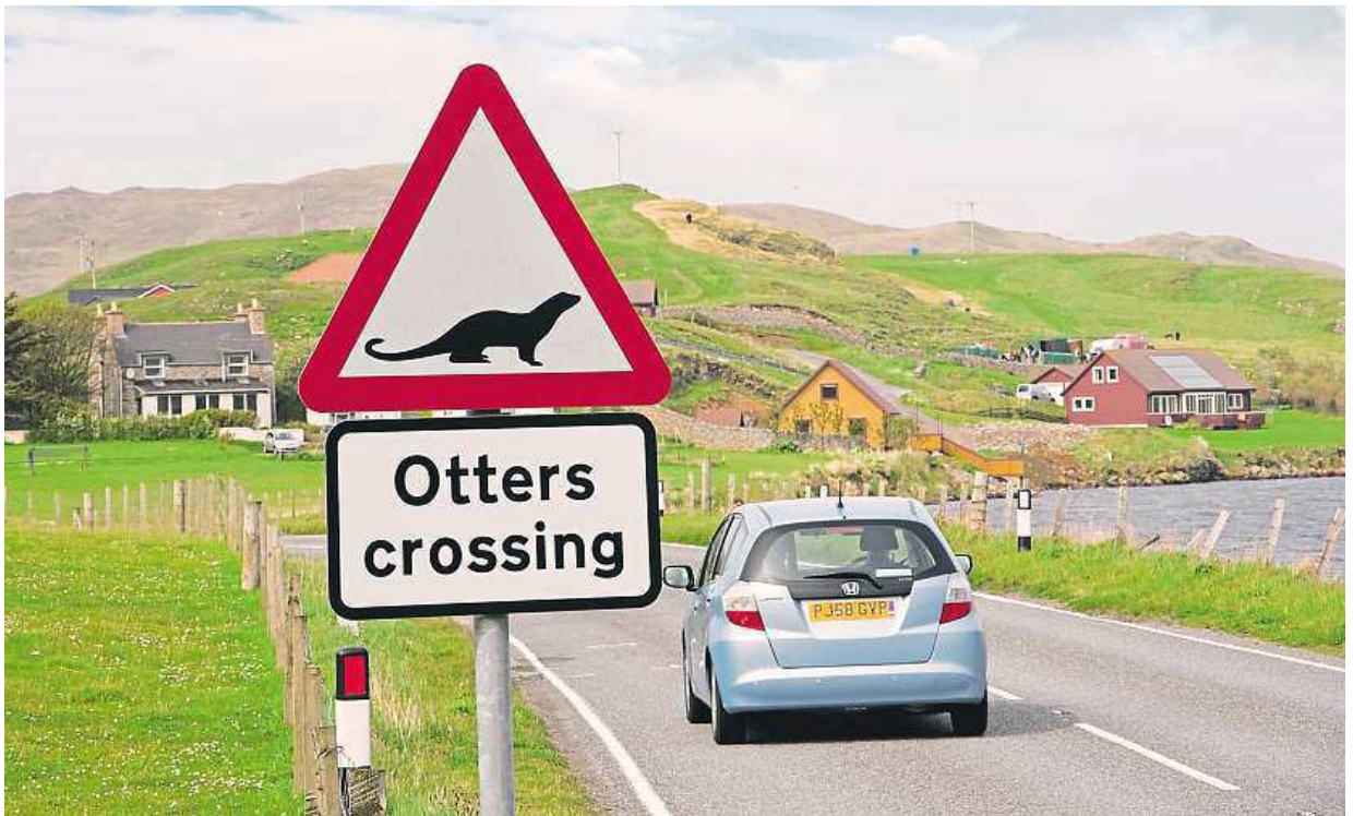
Do you know what this road sign mean?

The thought of driving in a foreign country - especially one where they drive on the wrong side of the road - can be a bit scary. Luckily, the rules of the road, and traffic signs are all fairly logical in Britain. MARSHA HENDERSON