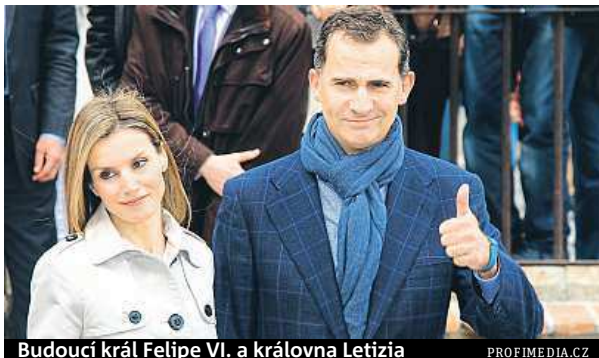
Budoucí král Felipe VI. a královna Letizia

Šestačtyřicetiletý Felipe je nejen podle svého otce, ale i podle španělského tisku připraven na trůn přímo skvěle. A aby ne, celý život byl vycho-