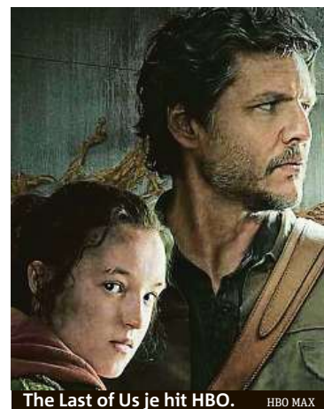
The Last of Us je hit HBO. HBO MAX

„Právě díky nejrůznějším slevám a promo akcím se mají šanci na trhu uchytit i nově přicházející streamovací služby. Lokální služby pak nejčastěji rostou díky zvýhodněným balíčům, tedy spojení s dalšími službami a nabídkami. Bez toho by neměly možnost dotáhnout se v popularitě na jinak dominantní Netflix,“ popisuje na základě dat z průzkumu dění na českém trhu Luzsicza a vysvětluje, že mezi těmi, co začali s využívat