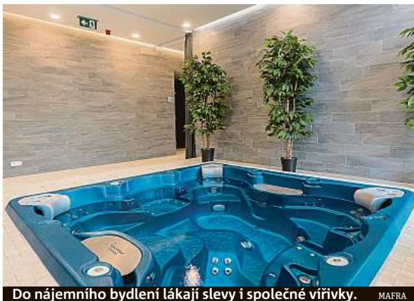
Do nájemního bydlení lákají slevy i společné vírivky.

„Polovina domácností plánujících hypotéku své rozhodnutí odložila nejčastěji kvůli rostoucím životním nákladům nebo proto, že čekají na výhodnější podmínky jak cen nemovitostí, tak úroko-