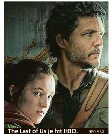
The Last of Us je hit HBO.

„Právě díky nejrůznějším slévám a promo akcím se mají šanci na trhu uchytit i nově přicházející streamovací služby. Lokální služby pak nejčastěji rostou díky zvýhodněným balíčům, tedy spojení s dalšími službami a nabídkami. Bez toho by neměly možnost dotáhnout se v popularitě na jinak dominantní Netflix,“ popisuje na základě dat z průzkumu dění na českém trhu Luzsicza a vysvětluje, že mezi těmi, co začali s využívá-