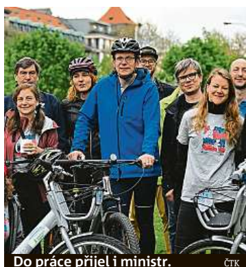
Do práce přijel i ministr.

Jedou bez benzínu 24 700 Do loňské květnové akce se zapojilo 24 700 lidí, letos by účastníků mohlo být víc. Akce začala už včera. Do práce na kole přijel s několika členy spolku AutoMat také ministr dopravy Martin Kupka.