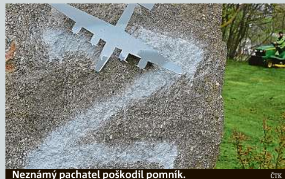
Neznámý pachatel poškodil pomník. ČTK

Město Most nabízí dotaci až dva miliony korun lékařům, kteří vybudují ve městě novou ordinaci. Dotace je určena praktíkům, pediatrům, stomatologům, psychiatrům a psychologům. Sever Čech se dlouhodobě potýká s nedostatkem lékařů. ČTK