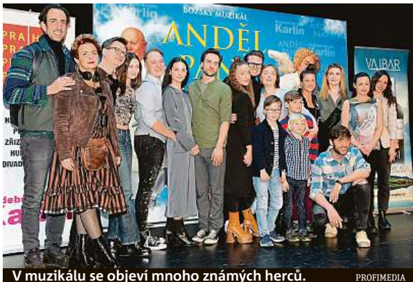
V muzikálu se objeví mnoho známých herců.