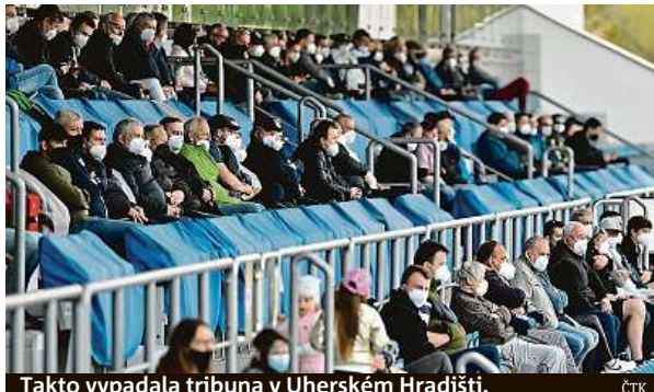
Takto vypadala tribuna v Uherském Hradišti.

Z ligy ale letos padají tři celky. Předposlední Příbram doma podlehla Českým Budějovicím 0:1 a také Středočechům se naděje na záchranu vzdaluje.