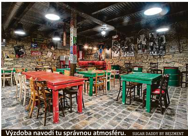
Výzdoba navodí tu správnou atmosféru. SUGAR DADDY BY BEJZMENT

V těchto dnech má podnik otevřené okénko nebo baštu rozváží, ale až padnou vládní omezení, tak určitě dorazte posedět. „Najdete u nás dvě