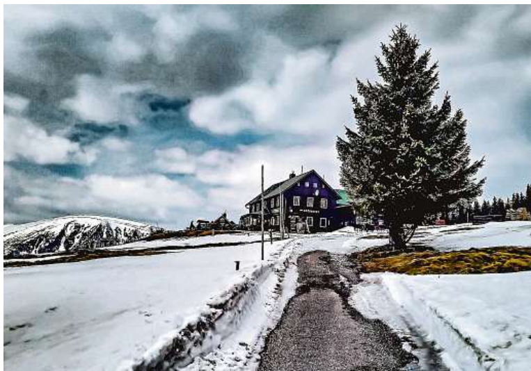
Na hřebenech Krkonoš ještě skialpy užijete, sníh se tu letos udrží dlouho.