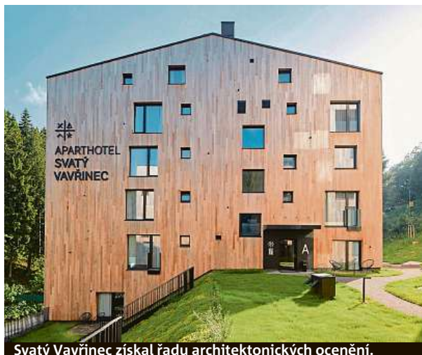
Svatý Vavřinec získal řadu architektonických ocenění.

Už tradiční akce Uklidíme Sněžku i pod Sněžkou se letos chystá na 5. června. „Nemilou odpadkovou stopu je třeba uklidit i na jaře, tak vzhůru do toho. Přijďte se i vy a pomozte nám vyčistit tento krásný kousek přírody,“ říkají organizátoři. Sledujte web pecpodsnezkou.cz . Tam si také přečtete informace o charitativním výšlapu na Sněžku, který se bude konat v sobotu 29. května.