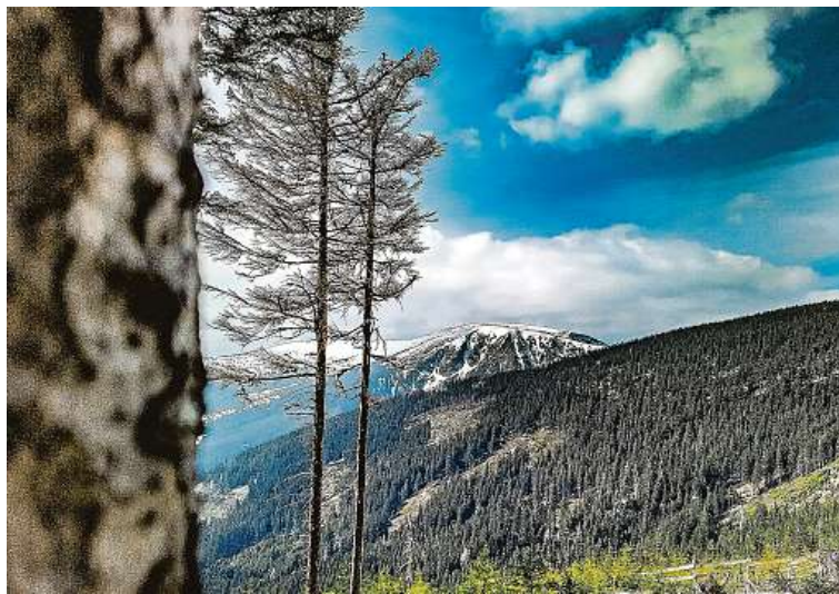
Lístek na lanovku na Sněžku bude jako bonus k ubytování.