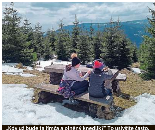
„Kdy už bude ta limča a plněný knedlík?“ To uslyšíte často.