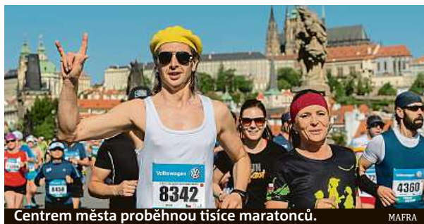
Centrem města proběhnou tisíce maratonců.

Na trase závodu a dalších souvisejících komunikacích bude platit zákaz parkování. V případě, že auta na komunikacích zůstanou, nechají je strážníci zákona odtáhnout. Do