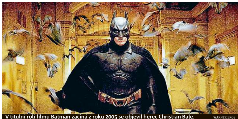
V titulní roli filmu Batman začíná z roku 2005 se objevil herec Christian Bale.