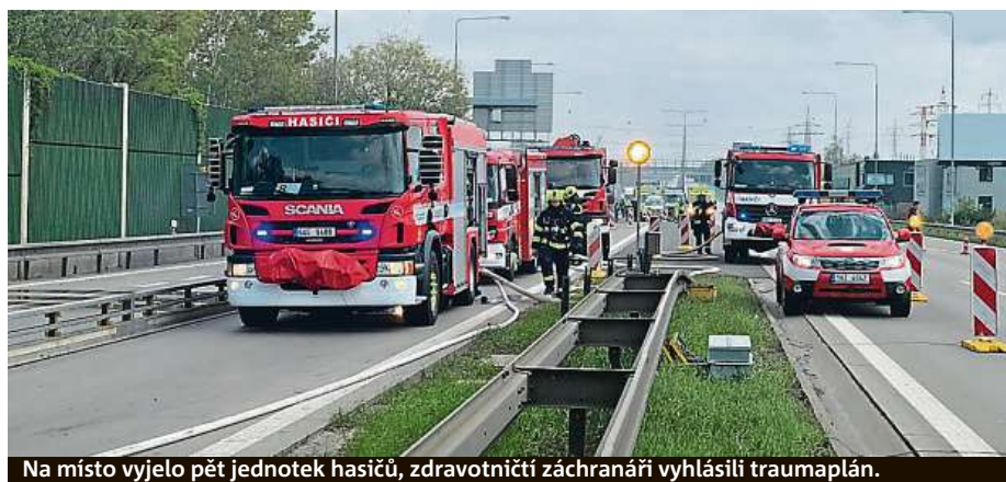
Na místo vyjelo pět jednotek hasičů, zdravotníci záchranáři vyhlásili traumaplán.