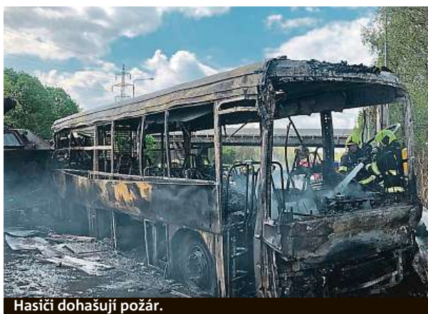
Hasiči dohašují požár.