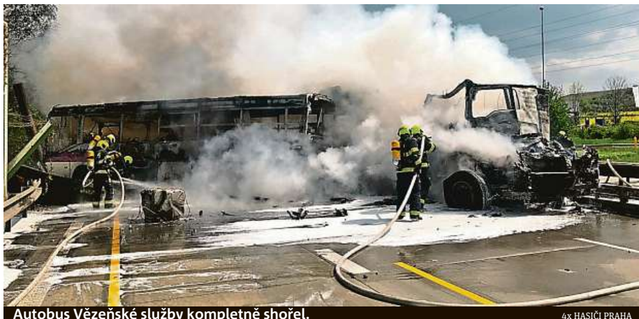
Autobus Vězeňské služby kompletně shořel.