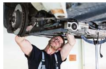
Montáž DPF je komplexní úkon s řadou kroků. Aby filtr bezvadně fungoval musí být provedena precizně, nejlépe v autorizovaném servisu.