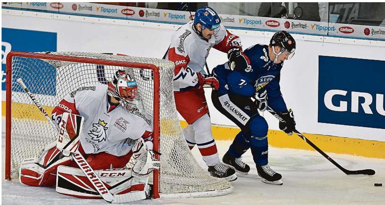
Čeští hokejisté vstoupili do turnaje Carlson Hockey Games v Brně porážkou s Finskem 2:3.

Mamahotely. Sedm z deseti mladých lidí zůstává v rodném hnízdě. Vlastní bydlení. Za jeho nedostupnost mohou vysoké částky za metr čtvereční i stále rostoucí úrokové sazby ze strany České národní banky STRANA 8