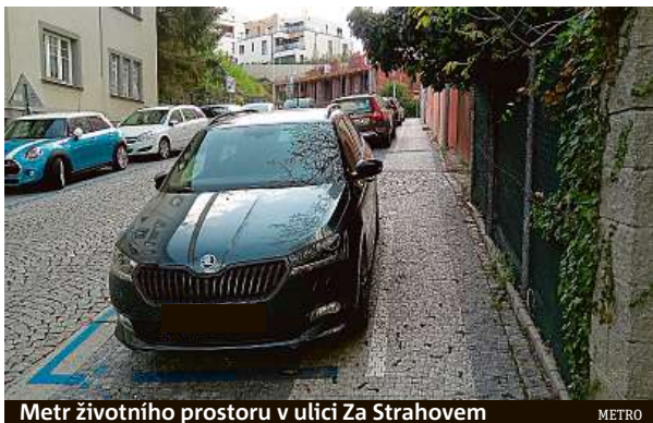
Metr životního prostoru v ulici Za Strahovem