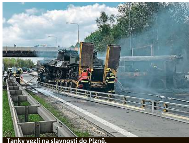
Tanky vezli na slavnosti do Plzně.