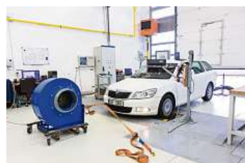
Měření probíhalo na špičkově vybaveném pracovišti Technické fakulty ČZU.

Pokud máte pochybnosti anebo má vaše auto zakouřený výfuk, nechte si stav DPF raději zkontrolovat. Nejlépe ve značkovém servisu pomocí moderních diagnostických přístrojů.