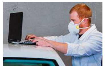
Měření prokázala, že vůz s odstraněnou vložkou DPF vypouští karcinogenní částice přímo do kabiny.