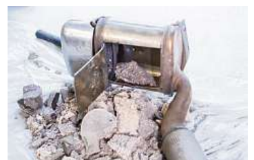
Z DPF testovacího vozu byla odstraněna voštinová keramická vložka s drahými kovy.