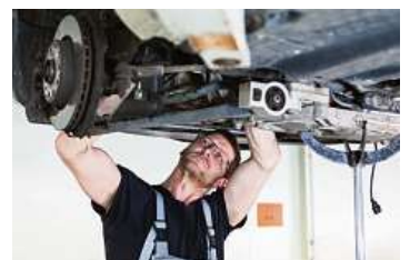
Montáž DPF je komplexní úkon s řadou kroků. Aby filtr bezvadně fungoval musí být provedena precizně, nejlépe v autorizovaném servisu.