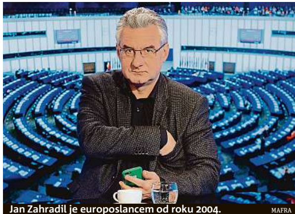
Jan Zahradil je europoslancem od roku 2004.

Zrovna nedávno při večerním zasedání se projednávala jedna smlouva EU s Vietnamem o vývozu dřeva. Měl ji uvádět jeden ze členů Evropské komise. Sáhl do tašky, vytáhl si projev, který byl určen k úplně jinému tématu, a začal ho číst. Teprve asi po minutě si uvědomil, že mluví k úplně jinému bodu. Omluvil se, strčil projev zpět do tašky a další minutu v ní hledal ten správný projev. To už se smál celý sál.