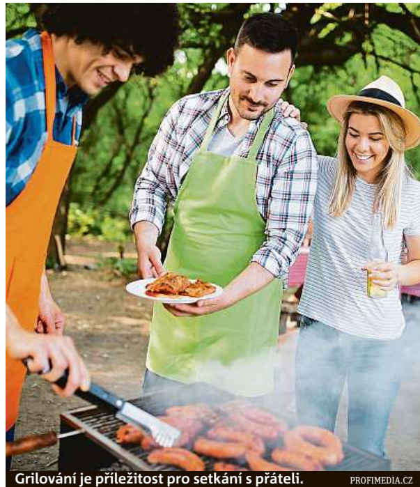
Grilování je příležitost pro setkání s přáteli.