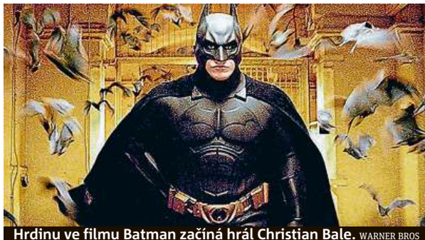
Hrdinu ve filmu Batman začíná hrát Christian Bale. WARNER BROS

Právě další filmové zpracování jeho dobrodružství je nyní předmětem vášnivých diskusí. Studio Warner Bros