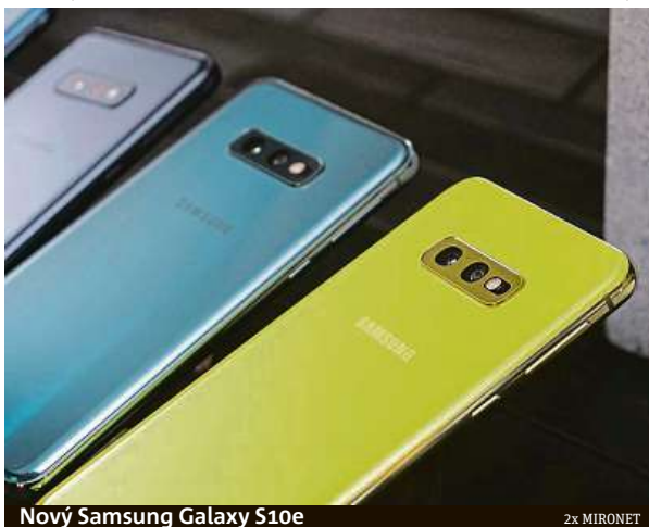
Nový Samsung Galaxy S10e

Například nový Samsung Galaxy S10e můžete mít kromě černé a bílé barvy také v zelené nebo zářivě žluté. Přitom se nejedná o žádné „ořezávkato“. Písmeno „e“ v názvu telefonu je zkratka pro „essential“ (nezbytný). S10e ale obsahuje mnohem více než jen to nezbytné. Telefon má stejný výkonný chipset jako zbytek rodiny S10. S „éčkem“ tedy dostanete silný a zároveň úsporný procesor s taktem až 2,7 GHz i 6 GB rychlé operační paměti RAM.