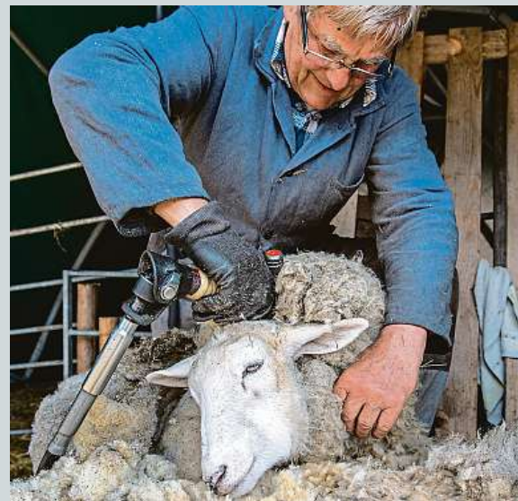
Strhání ovcí. Začala další náročná práce na horách.