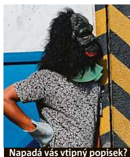
Napadá vás vtipný popisek?

Napište bublinu a reagujte na sloupek na: www.facebook.com/denikmetro