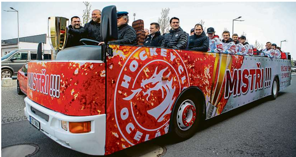
Hokejisté i realizační tým klubu Oceláři Třinec slavili zisk mistrovského titulu jízdu otevřeným autobusem ulicemi města.

Mamahotely. Sedm z deseti mladých lidí zůstává v rodném hnízdě. Vlastní bydlení. Za jeho nedostupnost mohou vysoké částky za metr čtvereční i stále rostoucí úrokové sazby ze strany České národní banky STRANA 2