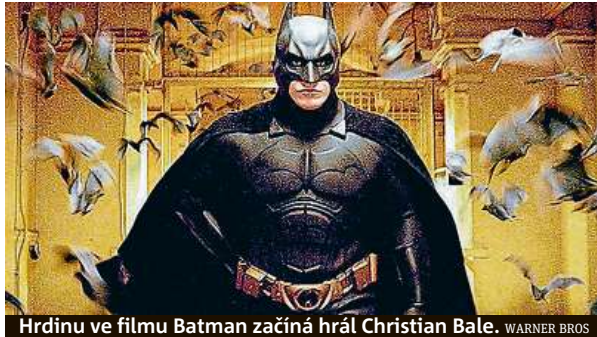
Hrdinu ve filmu Batman začíná hrát Christian Bale.

Právě další filmové zpracování jeho dobrodružství je nyní předmětem vášnivých diskusí. Studio Warner Bros