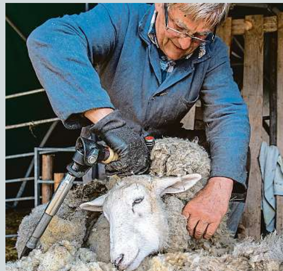
Strihání ovcí. Začala další náročná práce na horách.