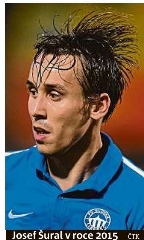
Josef Šural v roce 2015