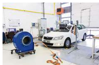
Měření probíhala na špičkově vybaveném pracovišti Technické fakulty ČZU.