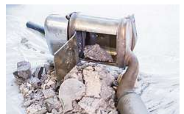
Z DPF testovacího vozu byla odstraněna voštinová keramická vložka s drahými kovy.