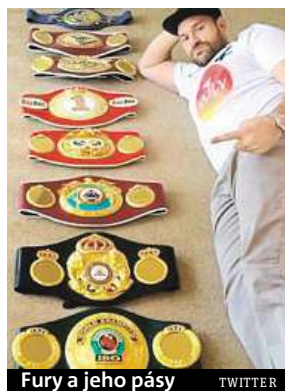
Fury a jeho pásy

Ten s odpovědí dlouho nečekal. „Jsem si jistý, že můžu porazit Joshuu s jednou rukou přivázanou za zády. Ani nebudu potřebovat rozsvičku, jestli chce dostat nakládačku,“ řekl Fury v rozhovoru pro Sky Sports. Navíc čerstvému držitelu titulů organizací IBF, WBA i IBO vzkázal, že v případě Klička porazil jen starého chlápka. „Byl jsem