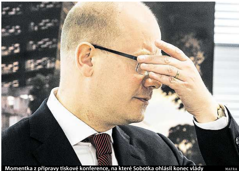
Momentka z přípravy tiskové konference, na které Sobotka ohlásil konec vlády

Demisi kritizují i jiní ministři. „Nerozumím kroku pana premiéra, svým počínáním doslova pohřbívá celou úspěšnou vládu,“ uvedla ministryně pro místní rozvoj Karla Šlechtová. „Bereme to tak, že si premiér vzal zemi jako rukojmí, aby ukázal ramena. Zároveň řekl, že se chce potkat s předsedy koaličních stran. Je otázka, co chce řešit. Šest měsíců před volbami dává rozhodování do rukou pana prezidenta,“ uvedl ministr životního prostředí