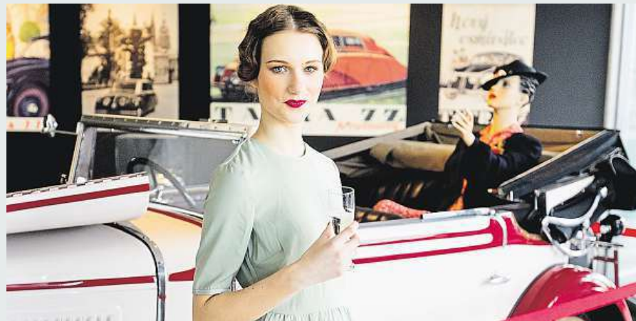
V Tančícím domě v Praze se dnes otevírá výstava představující první republiku.