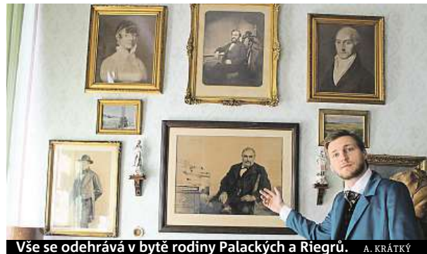
Vše se odehrává v bytě rodiny Palackých a Riegrů. A. KRÁTKÝ

Na návštěvu do salonu, kde vznikl moderní český národ, nahlédnou diváci divadelního představení Prosíme nesahat.