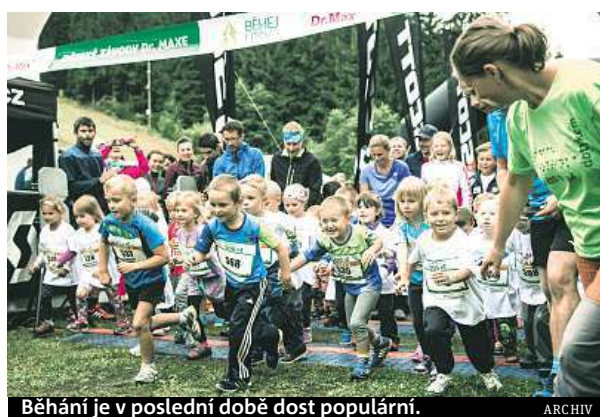
Běhání je v poslední době dost populární.

Běhejte na různém druhu povrchu – tráva, polní cesta, asfalt. Strídejte během týdne své tempo. Posilujte své tělo, zvýšíte tím sílu pohybového aparátu. Nezapomínejte na strečink. Naplánujte si čas na regeneraci. A kdyby náhodou došlo ke zranění, léčbu neodkládejte.