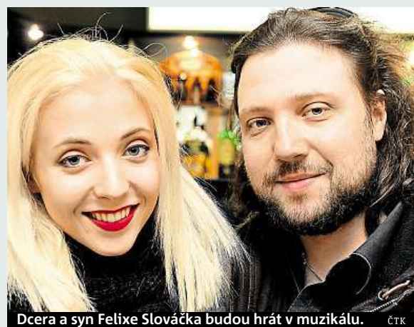
Dcera a syn Felixe Slováčka budou hrát v muzikálu.