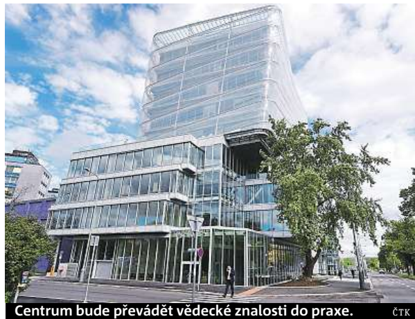
Centrum bude převádět vědecké znalosti do praxe.