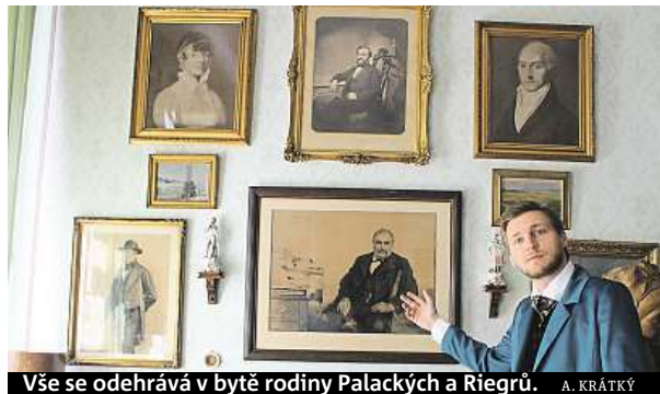
Vše se odehrává v bytě rodiny Palackých a Riegrů. A. KRÁTKÝ

Na návštěvu do salonu, kde vznikl moderní český národ, nahlédnou diváci divadelního představení Prosíme nesahat .