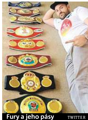
Fury a jeho pásy

Ten s odpovědí dlouho nečekal. „Jsem si jistý, že můžu porazit Joshuu s jednou rukou přivázanou za zády. Ani nebudu potřebovat rozsvičku, jestli chce dostat nakládačku,“ řekl Fury v rozhovoru pro Sky Sports. Navíc čerstvému držiteli titulů organizací IBF, WBA i IBO vzkázal, že v případě Klička porazil jen starého chlápka. „Byl jsem mimo ring stejně dlouho jako Kličko. Rozdíl je, že mně není 41, ale 28,“ uvedl Fury.