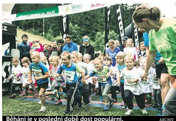
Běhání je v poslední době dost populární.

Běhejte na různém druhu povrchu – tráva, polní cesta, asfalt. Strídejte během týdne své tempo. Posilujte své tělo, zvýšíte tím sílu pohybového aparátu. Nezapomínejte na strečink. Naplánujte si čas na regeneraci. A kdyby náhodou došlo ke zranění, léčbu neodkládejte.