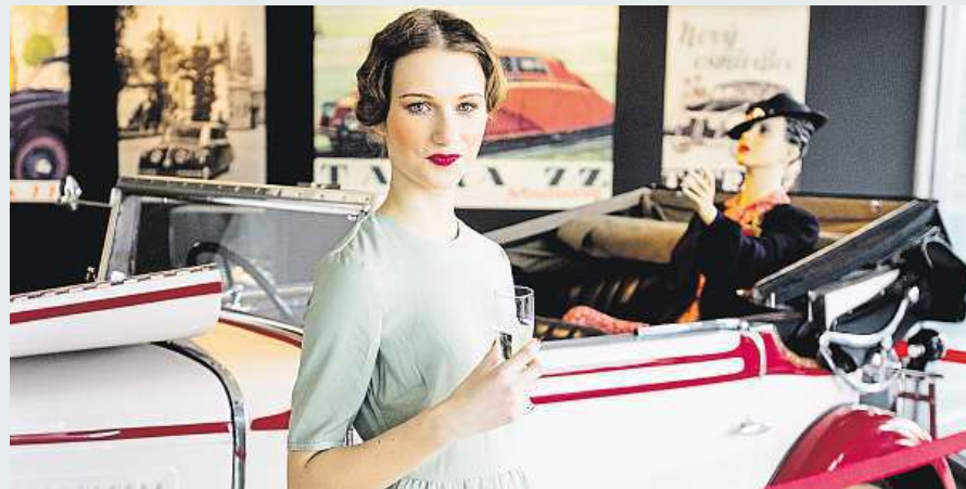
V Tančícím domě v Praze se dnes otevírá výstava představující první republiku.