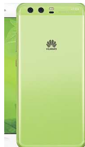
Zelený Huawei P10

Pokud tedy toužíte po špičkovém telefonu, který v Česku vlastní pouze hrstka šťastných majitelů, je Huawei P10 Greenery jednoznačnou volbou.