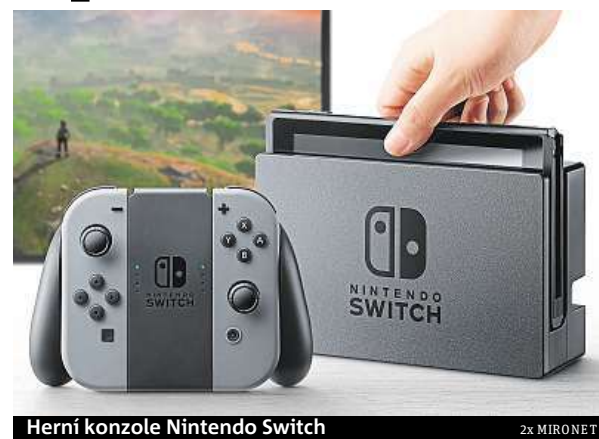
Herní konzole Nintendo Switch

Abyste vám další vlna nedostatkových konzolí neprotekla mezi prsty, doporučujeme vytvořit předobjednávku co nejdříve. Hráčů toužících po revolučním hraní Zelda, Maria a dalších je totiž stále násobně více než Nintendo do- dávaných kusů.