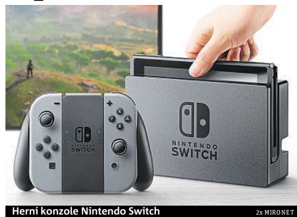
Herní konzole Nintendo Switch

Abyste vám další vlna nedostatkových konzolí neprotekla mezi prsty, doporučujeme vytvořit předobjednávku co nejdříve. Hráčů toužících po revolučním hraní Zeldy, Maria a dalších je totiž stále násobně více než Nintendo do- dávaných kusů.