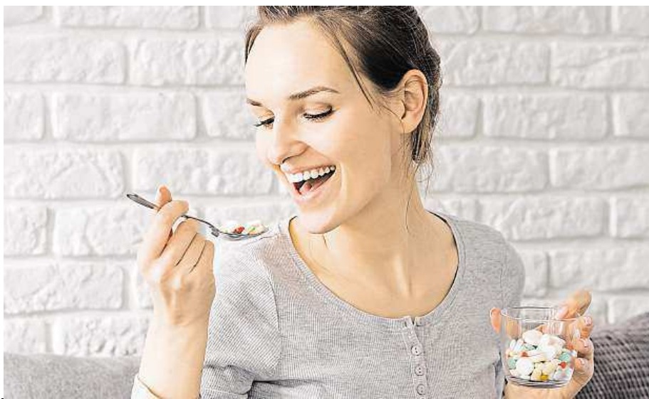
Dejte pozor, doplněk stravy problém nevyřeší.

Poskytují organismu živiny, které potřebujeme a které nezískáváme v dostatečné míře z potravin. Doplnění stravy, jakožto potraviny obohacené o vitaminy a minerální látky, mohou být doplněním řádné léčby pacienta (třeba v rámci nutričních opatření),