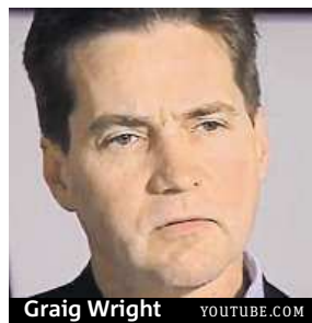
Craig Wright

Doposud Wright vystupoval pod pseudonymem Satoši Nakamoto. Měna bitcoin vznikla