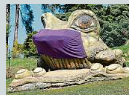
Žába v Tršici

Lidová tvořivost neutíhá ani v době pandemie. Na návsi v obci Tršice na Olomoucku někdo místní 10tunové soše – obří žábě – opatřil roušku.