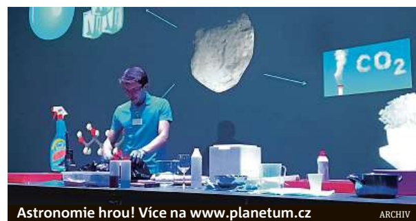
Astronomie hrou! Více na www.planetum.cz

Aktuality se budou postupně objevovat nejen na webu, ale i na sociálních sítích a YouTube kanálu.