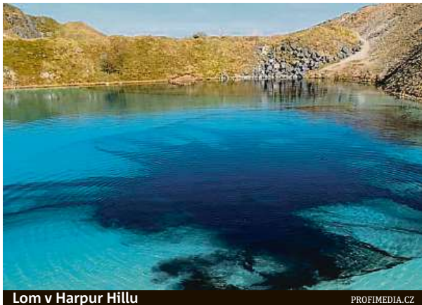
Lom v Harpur Hillu

Minulé pondělí zakázal britský premiér Boris Johnson obyvatelům opouštět domovy, aby zabránil dalšímu šíření koronaviru. „Pokud ne-