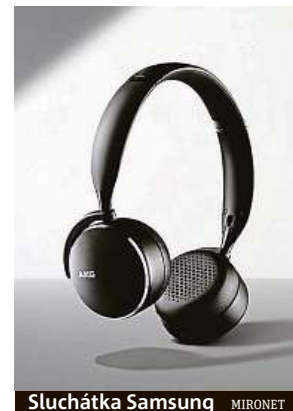
Sluchátka Samsung MIRONET

A kde tato skvělá sluchátka koupit? SAMSUNG AKG N60NC Stereo Wireless doporučujeme pořídit v internetovém obchodě Mironet. Koupíte je zde za 3198 korun a ze způsobu přeprav můžete využít funkci bezkontaktního doručení, které vám zaručí maximální bezpečí a prevenci při nákupu. Pořízení perfektních bezdrátových sluchátek je tak snadné a naprosto bezpečné.